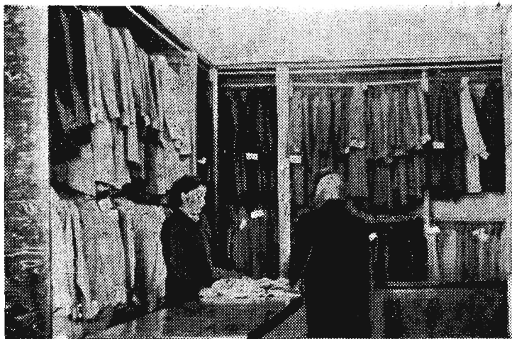
Państwowe i spółdzielcze sklepy, wypelnione „po brzegi“ tekstyliami i gotową konfekcją całkowicie zlamali nadzieje spekulantów, którzy z takim zapalem wykupywali materiały włókiennicze.