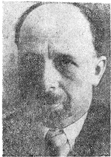
Walter Ulbricht sekretarz generalny Socjalistycznej Partii Jedności Niemiec.

Przed Socjalistyczną Partią Jedności Niemiec stoją olbrzymie zadania. Przewodzi ona walce narodu