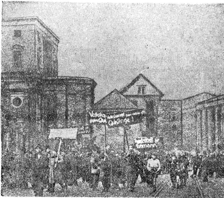
Ludność w Niemczech Zachodnich wyraża w masowych demonstracjach swój głęboki protest przeciw terrorowi i politycznym prześladowaniom przez tzw. rząd Adenauera i zarazem składa dowody nieugiętej woli walki o pokój.

Na rozkaz Adenauera, parlament krajowy w Nadrenii przyjął hitlerowską rezolucję o rozwiązaniu frakcji parlamentarnej KPD w Düsseldorfie. Wielu posłów KPD zarówno do „parlamentu” w Bonn jak i w parlamentach krajowych wykluczonych jest na wiele miesięcy z udziału w obradach względnie przebywa w więzieniu. Za Maxem Reimannem wysłał się już listy gończe.