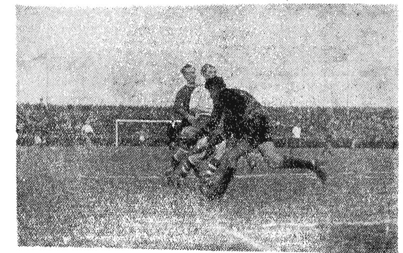
Tak grali w Warszawie w roku ubiegłym. — Na zdjęciu sytuacja z meczu Polska — Bulgaria.