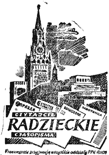
Pracownicy przyjmują wszystkie oddziały PPK-RUCH

Chlubne osiągnięcia w pracy przyniosły młodzieży radzieckiej uznanie całego narodu. Na wezwanie Partii i Wodza narodu radzieckiego, towarzysza STALINA, młodzi patrioci ZSRR budowali w okresie przedwojennych pięcioletek olbrzymi socjalistyczny przemysł, zakładali miasta w tajdze, zdobywali Arktykę, przyczyniali się do zwiększenia obronności kraju.