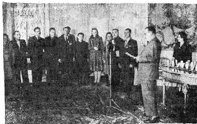
Z okazji Dni Oświaty, Książki i Prasy Prezydent RP Bolesław Bierut udekorował w dniu 19 maja 1951 r. w Belwederze Krzyżami Kawalerskimi Orderu Odrodzenia Polski 19 korespondentów robotniczych i chłopskich za ich wybitne zasługi w pracy społecznej.

Znamenny przebieg miało głosowanie w jednej z kopalń Gelsenkirchen. Referendum odbywało się tam w obecności