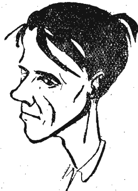
Cieślik (Unia — Chorzów)

między krakowską Gwardią, a chorzowską Unią. Zasadniczo nie liczone się z wygraną Unii a ogólnym sympatyków piłkarstwa liczył na zwycięstwo gwardzistów. Jednak wszystkie obliczenia okazały się nieaktualne.