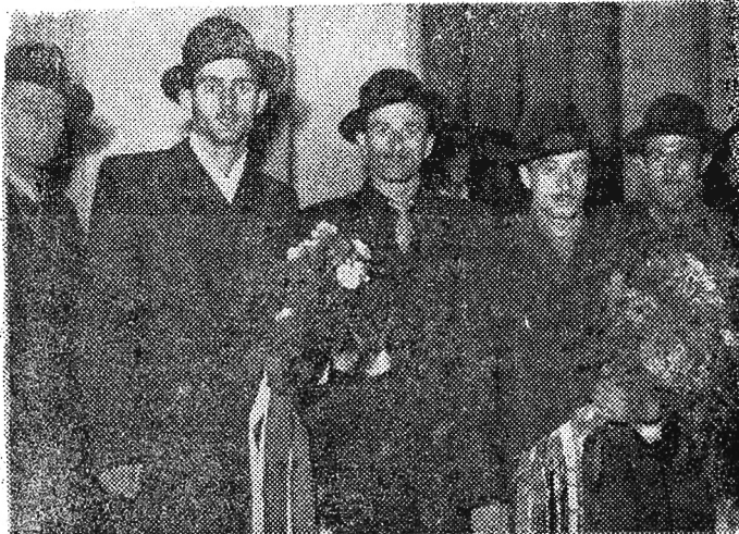
W dniu 25 października br. przybyli do Warszawy piłkarze z „Dynamo” (Tbilisi) którzy rozegrają w czasie trwania Miesiąca Pogłębienia Przyjaźni Polsko-Radzieckiej kilka spotkań z piłkarzami polskimi.