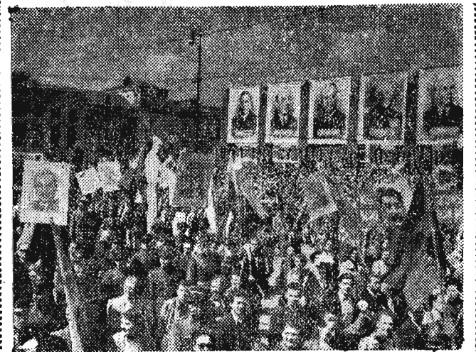
Na zdjęciu: Pochód 1 majowy. Ramię w ramię maszerują robotnicy, inteligenci pracujący, żołnierze i oficerowie Ludowego Wojska Polskiego.