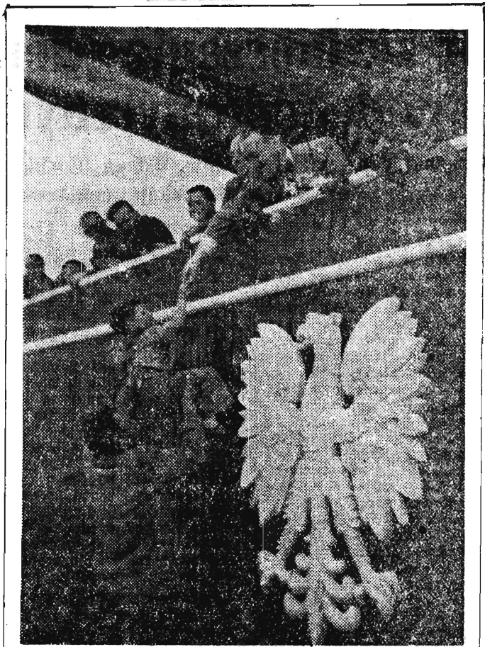
Na zdjęciu: Prezes Rady Ministrów Bolesław Bierut dziękuje małemu obywatelowi za kwiaty ofiarowane Mu przez dzieci Warszawy w czasie uroczystości 1-majowych.

Wysokim plomieniem bije w fabrykach, we wsiach, na