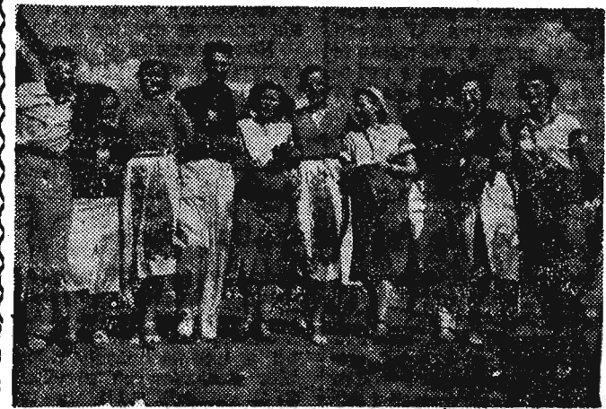
Na zdjęciu: Grupa sportowców radzieckich i polskich na IV Światowym Festiwalu Młodzieży i Studentów w Bukareszcie.

5 sierpnia br. w Ministerstwie Spraw Zagranicznych Republiki Argentyńskiej podpisano układ handlowy i płatniczy między Związkiem Socjalistycznym Republiki Radzieckiej a Republiką Argentyńską.