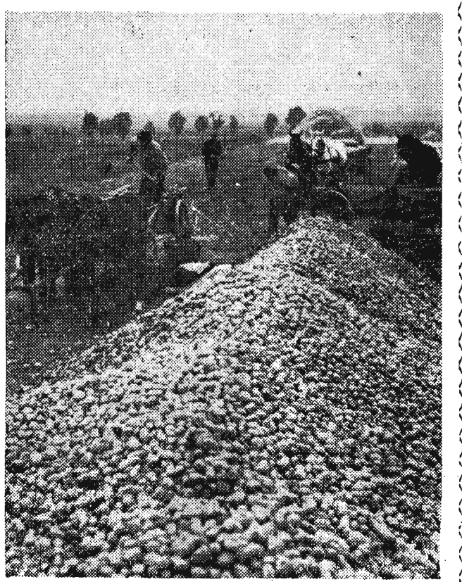
Z każdym dniem zwiększa się liczba rolników, którzy oddawali już całą ilość zboża, żywca, mleka i ziemniaków przypadającą na ich gospodarstwa. Liczni chłopcy chcą w terminie wywiązać się z obowiązku dostawy, zwozić ziemniaki do punktu skupu bezpośrednio z pola. Na zdjęciu: Ogólny widok punktu skupu ziemniaków Gminnej Spółdzielni w Bieisku pow. Płock (woj. warszawskie) CAF — fot. Baranowski.

Komitet Gminny winien był zmobilizować wszystkie siły, wszystkie środki wykorzystując do walki o realizację skupu zboża, żywca i mleka. Obiektywne przeszkody w tym wypadku są możliwe do usunięcia. Działają tutaj również inne przyczyny, a i z tymi można się uporać.