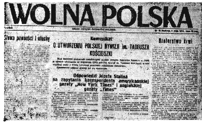
Reprodukcja gazety „Wolna Polska”, w której ukazał się Komunikat o utworzeniu Polskiej Dywizji im. Tadeusza Kościuszki oraz odpowiedź Józefa Stalina w sprawie stosunku Rządu Radzieckiego do sprawy Polski.

Pomoc, przyjaźń, przykład ZSRR... Te trzy pełne głębokiej treści słowa określają ów bezcenny skarb, który legł u źródeł wszystkich zwycięstw i sukcesów Polski Ludowej. Wszystkie, bo nie ma takiej dziedziny w naszym życiu, której osiągnięcia nie byłyby związane z braterskim sojuszem z Krajem Rad.