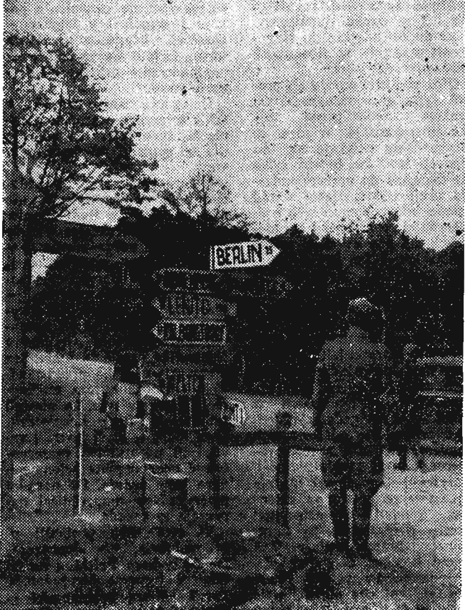
Oddziały I Armii WP w drodze na Berlin.

Radziecki najnowocześniejszy sprzęt bojowy i radzieccy instruktorzy, którzy kształcili kadry naszego ludowego wojska — to decydujące czynniki naszych zwycięstw. Żołnierz polski, który w sanacyjnym wojsku znał tylko lance, przestarzałe karabiny i działa, został wyposażony w sprzęt, którego opanowanie musiał dopiero się uczyć. Uczyli go tego radzieccy instruktorzy. A równocześnie trzeba było stworzyć kadry dowódców ludowego wojska, dowódców, którzy potrafią kierować walką z potężnym, uzbrojonym po zęby hitlerowskim wrogiem. Dzięki pomocy oficerów radzieckich wyszkolono w krótkim czasie tysiące młodych, ludowych dowódców. Ucząc się od wychowanych w stalinowskich szkołach strategii i taktyki oficerów radzieckich kunsztu dowodzenia, czerpiąc z ich przebiegłych doświadczeń, wzorując się na ich postawie