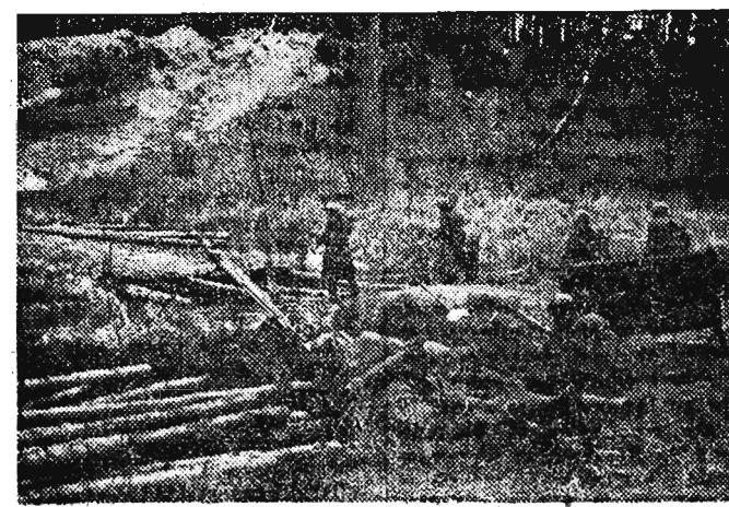
Walki oddziałów I Armii WP o Wal Pomorski.

broni najlepszych synów narodu polskiego i narodów Rosji, Ukrainy i Białorusi — przejął i rozwinął ruch robotniczy Polski i Rosji.