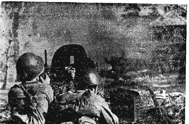
Żołnierze Wojska Polskiego w walce na przedpolach Pragi (wrzesień 1944 rok).

„Nasze Wojsko Ludowe — mówił towarzysz BIERUT na VIII Plenum — otoczony miłością całego narodu i opieką państwa, złączonego nierozzerwalną przyjaźnią, braterstwem ze Związkiem Radzieckim i wszystkimi siłami światowego obozu pokoju, demokracji i socjalizmu, potrafi odepierać wszelkie zakusy agresorów na nienaruszalne granice Polski Ludowej, potrafi strzec i bronić wolności polskiej i wielkiej sprawy polskiej”.