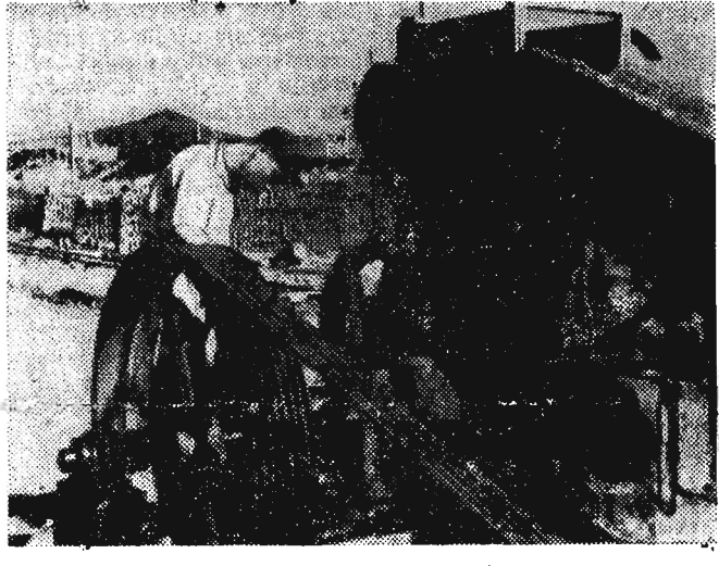
Cały naród koreański z równym zapałem, jaki wykazał w okresie wojny, walczy obecnie o dźwignię kraju z ruin. Robotnicy cegielni w Taisen zwiększają produkcję cegieł dla odbudowy kraju.