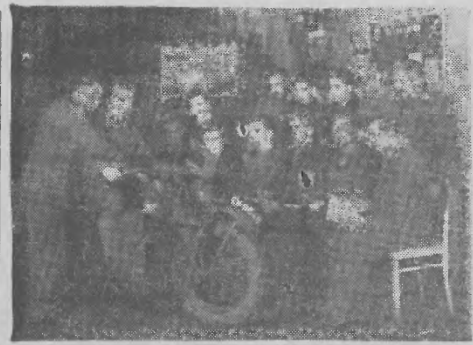
Około 1.200 swych członków przeszło w roku bieżącym Zarząd Wojewódzki LPZ na kursach motorowych I i II stopnia Dżeniem LPZ jes., by jak najwcześniej zrzeszonych w niej obywateli zdobyło, kwalifikacje i otrzymało pozwolenia na prowadzenie pojazdów mechanicznych

W dniu 27 bm. Zarz. Okr. ZBoWiD organizuje w Rzeszowie spotkanie społeczeństwa z uczestnikami międzynarodowego zjazdu byłych więźniów iaszystowskich obozów koncentracyjnych, taki — staraniem Międzynarodowej Federacji Uczestników Ruchu Oporu — odbędzie się w Oświęcimiu w dniach 25 — 26 bm. W spotkaniu tym wezmą udział delegaci ZBoWiD z całego województwa. Swit.