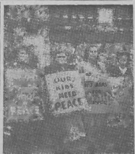
Na wielu zgromadzeniach i manifestacjach pokojowych ludność pracująca Anglii protestuje przeciw remilitaryzacji Niemiec Zachodnich i przeciwko przygotowaniom do nowej wojny. Na zdjęciu: Zgromadzenie pokojowe na Trafalgar Square w Londynie. Te kobiety zostały aresztowane przez policję i skazane za „zakłócenie porządku”

Nowy rok zaczął się dla nas wszystkich wielkim głosem naszych czasów: zwycięstw, pokoju.