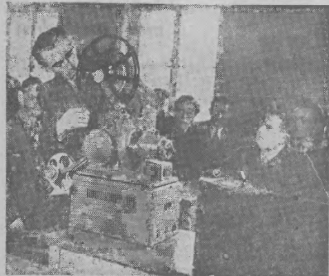
W świetlicach i klubach przy zakładach pracy film oświatowy cieszy się dużym powodzeniem. Dla obsługi sieci kina objazdowego kształcą się kadry operatorów aparatów krótkometrażowych.