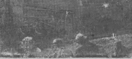
Wysadzenie podłoża na Hali Starachowice - Skarżysko Kamienna przez