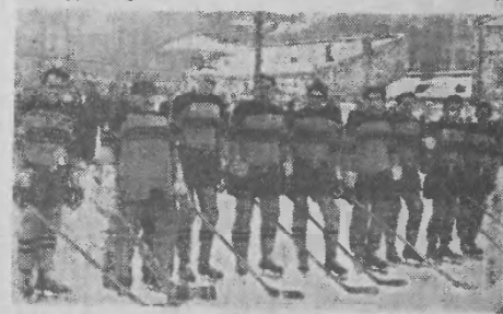
Drużyna hokejowa Jarosławskiej Spójni