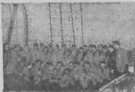
Wzrost: Reprezentanci Polski na podjeździe statku w drodze do Norwegii.