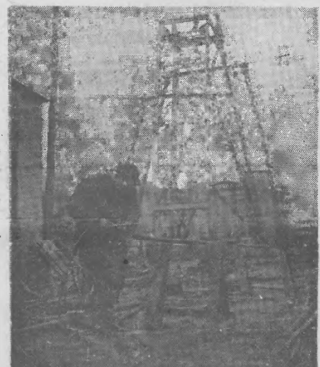
W dniu 14 grudnia 1950 roku opublikowana została uchwała Prezydium Rządu o niezwłocznym rozpoczęciu pracy przy budowie warszawskiego metra

Na tym porządek dzienny zo-stał wyzerpany. O terminie na-stępnego posiedzenia nastąpił oddzielnie zawiadomienia.