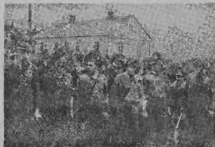
Przed startem do ostatniego podstępu marszów patrolowych.

Do prac przygotowawczych, związanych z przeprowadzeniem marszów patrolowych i sztafetowych zmobilizowany został aktywny ZMP — oświadczył sportowy. Na akcję te składamy szczególnie wielkie nadzieje, gdyż chcemy wykazać, że nasza socjalistyczna kultura fizyczna związana jest ściśle z tożsamością polityczną i ekonomiczną. Chcemy wykazać, jak wielkie są zdobycze naszego ludu pracującego, o które walczą polska klasa robotnicza. Dzięki wytrwałej walce towarzyszy z PPR, której dziesięciolecie obecnie obchodzimy, szczytamy się nie tylko zdobyciami