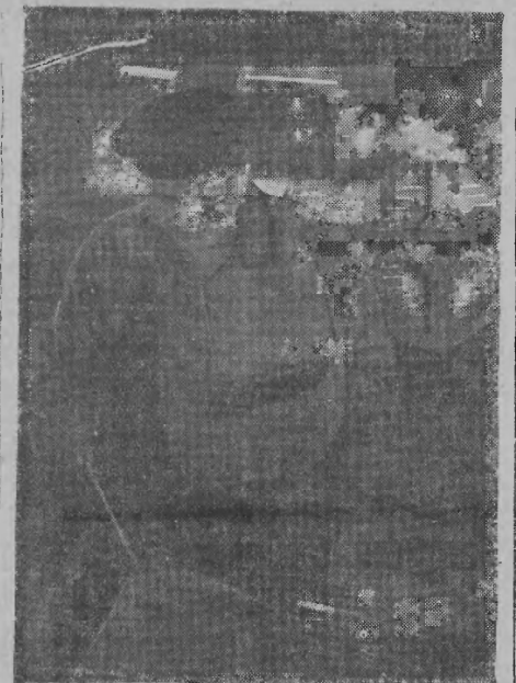
Na zdjęciu: 1. Zostawienie sprzączki Stocznia im. Komuny Paryskiej w Gdyni — Irena Krzyżkowska — wyrabiająca 200 proc. normy

W powiecie łańcuckim zobowiązania podjęli już zalogi wszystkich niemal zakładów pracy. Wartość zobowiązań jedynie PMS-u wyniosła 342.000 złotych. Przysługującą oszczędność zobowiązania podjęli poza tym robotnicy powiatu łańcuckiego.