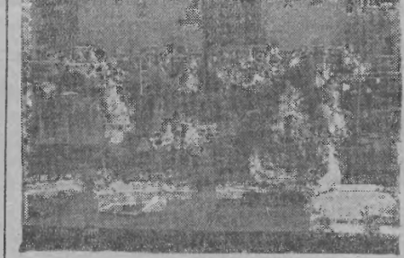
W czysty bibliotek, młodzież polska zdobywa wiedzę i pogłębia swoje kwalifikacje zawodowe. Na zdjęciu: Młodzież w bibliotece publicznej w Warszawa.

Jestem wdzieczna ogromnie naszemu ludowemu rządowi, naszej partii za to, że mogę uczyć się, za to, że rodzice moi nie cierpią już nędzy, za to, że w Polsce nie ma już głodnych dzieci”.