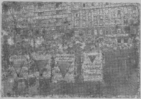
W rocznicę wydarzeń lutowych 1934 roku odbywały się w Wiedniu manifestacje robotnicze. Na zdjęciu: Fragment pochodu