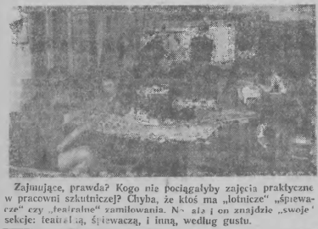
Zajmujące, prawda? Kogo nie pociągałyby zajęcia praktyczne w pracowni szkutnikowej? Chyba, że ktoś ma „lotnicze”, „śpiewacze” czy „teatralne” zamiłowania. N- ale i on znajdzie „swoje” sekcje: teatralną, śpiewaczą, i inną, według gustu.