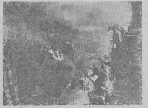
Dnia 2 maja 1945 roku zakończyła się zwycięska bitwa o Ber lin. Sztandar Radziecki został zafikszony nad Reichstagiem. Na zdjęciu: Sztandar Radziecki — Sztandar Zwycięstwa powieszony nad Reichstagiem.