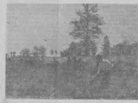
Na terenie województwa szeszczyńskiego pracuje od kilku tygodni przy sianokosach szereg grup chłopów mało i średniorolnych z województw Polski centralnej.

Czy zanieść już złom metalu niezależnego do najbliższego punktu skupu?