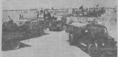
Na południu Związku Radzieckiego rozpoczęło już skup zbóż. Na zdjęciu: Ziarno z kotchozów Sałjańskiego rejonu Azerbejdżańskiej SRR jedzie do punktów skupu.

Minister Obrony Narodowej (—) Konstanty Rokossowski Marszałek Polski