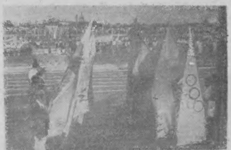
Barceni wygłądała kolumna sportowa na stadionie Ognia w Rzeszowie. Na pierwszym planie poczty sztandarowe zrzeszeń sportowych.

Jednym z nieludziwych jest to, że poszczególne zrzeszenia sportowe w naszym województwie nie należały zmobilizować swoich członków do udziału w święcie, czego wyrazem jest mała liczba (3590 osób) sportowców z zrzeszeń uczestniczących w święcie. Pełną frekwencję za bezpieczeństwo młodzieży szkolna, która z entuzjazmem, masowo stawiała się na boiskach w dniu Święta Kultury Fizycznej.