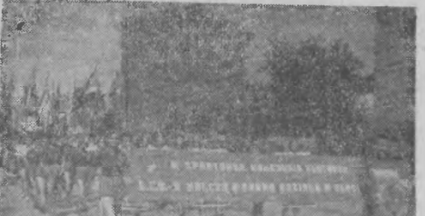
Członkowie LZS w defiladzie podczas Święta Kultury Fizycznej w Rzeszowie.