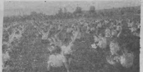
Grupa młodzieży szkolnej wykonała wspólnie popisy gimnastyki.