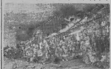
Przyjemnie spędzała czas młodzież Państwowego Technikum Mechanicznego WSK Rzeszów.

ku — 5,45 m, przed Chlebustem (obóz) — 5,30 m i Sipiwcem (obóz) — 5,10. W pełniącą kulą najlepszy wy-