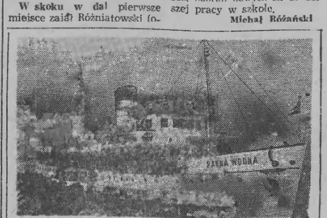
Po raz pierwszy w roku bieżącym na reprezentacyjnym statku żegluj przybrzeżnej s/s „Panna Wodna” zorganizowano jedynogodzinowe wczasy dla świata pracy.