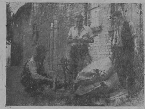
W akcji festennej wielkie znaczenie ma stosowanie pod zastęwy naszowców sztucznych. Wiele gosp. arstw zespolonych i indywidualnych doceniają znaczenie wysuwu naszowców sztucznych wycznie zaopatrzony się w nie w gminnych spółdzielniach. Na zdjęciu: Członkowie spółdzielni produkcyjnej — Sólniki — Male w woj. wrocławskim pobierają naszowcy sztuczne w magazynie GS w Sólnikach.

W skali miesięcznej, daje to 60 godzin. A 60 godzin, to jest siedem i pół zmiany, tracąc po osiem godzin na zmianę. Jeśli znowu przyjmijemy, że w ciągu jednej zmiany, wiercimy cztery godziny, to miedzy sobą stracimy podczas jednej zmiany 30 minut, a w miesiącu wypracowania mogłaby być potrzebna do pełnego wykonania planu produkcyjnego Centrali Naftowej maszynowców Krosińskiego Instytutu Naftowego, oraz ich ścisła współpraca z robotnikami, zmieniającą do spularyzowania nowych, wydajniejszych redzieckich metod pracy, pozwolił na pełniejsze wykorzystanie rezerwy produkcyjnych, mających tak wielkie znaczenie dla wykonania napływających trudnych planów w przemyśle naftowym. Cz. Berenda