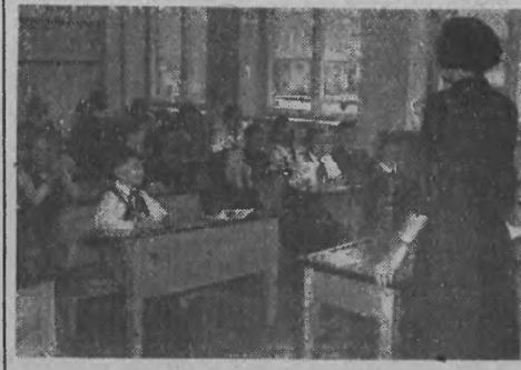
Szkola TPD nr 23 przy ul. Nowolejskiej w Warszawie, rozpoczęła pracę w nowowzbudowanym gmachu szkolnym — jednym z najpiękniejszych w stolicy. Już od pierwszej lekcji dzieł z zapamiętaniem się do nauki.