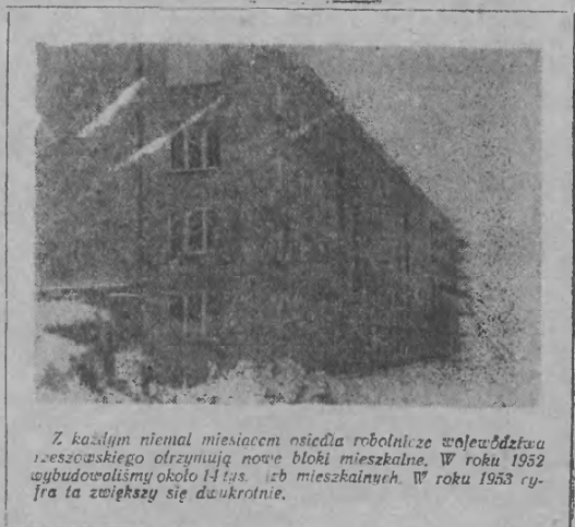
Z każdym niemal miasteczkiem osiedla robotnicze województwa rzeszowskiego otrzymują nowe bloki mieszkalne. W roku 1952 wybudowaliśmy około 14 tys. izb mieszkalnych. W roku 1953 cy- fra ta zwiększy się dwukrotnie.