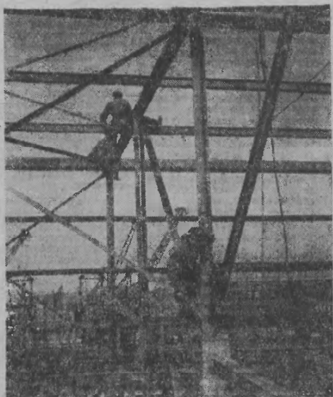
Budowa kombinatu w Nowej Hucie