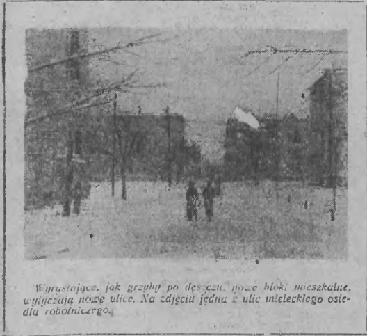
Wyrastające, jak grzyby po deszczu, nowe bloki mieszkalne, wycięzają nowe ulice. Na zdjęciu jedna z ulic mieleckiego osie- dła robotniczego.