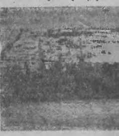
„Ta stara, świecąca dziurami obota była ich pierwszym „majtkiem”

Jaskrawa, czerwona linia zamknięcia długiego szeregu nitki jedna pod drugą pisanymi cyfr. Linia ta zamknięcia rachunki gospodarcze spółdzielni produkcyjnej w Grudnie Kępskiej za rok 1952 — trzeci rok wspólnej pracy.