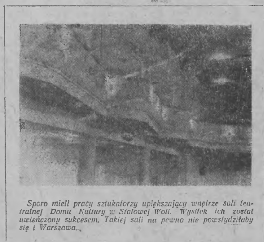
Spora mieli pracy sztuczkarzy upiększający wnętrza sali teatralnej Domu Kultury w Stalowej Woli. Wystrój ich został uwieczniony sukcesem. Takiej sali na pewno nie powstydziłaby się i Warszawa...

trzeć. Nie tak przecież dawno, gdy ojciec sprowadził z Zawlechostu całą rodzinę do Stalowej Woli i ulokował ją w jednym z mieszkań dopiero co wybudowanego ośmiorobnego bloku mieszkalnego — z kuchennego okna widok na ludzi w wale nie był jeszcze tak imponujący, jak dzisiaj.