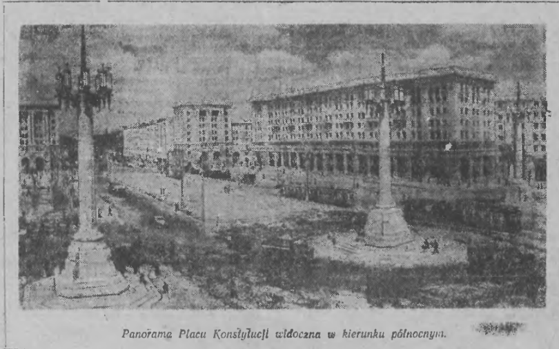
Panorama Placu Konstytucji widziana w kierunku północnym.

Dziesiątki nazwisk przodowników, zasłużonych ofiarnych, bezgranicznie oddanych. Nazwiska radzieckich przyjaciół, o których zalega Dychow mówił tak gorąco, serdecznie, którzy uczyli polskich towarzyszy zasad najnowo-