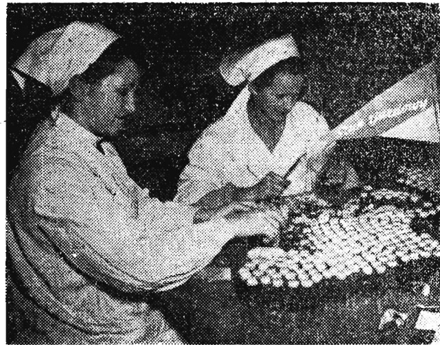
Załoga Zakładów Przemysłu Chemicznego „Fabianice”, która już w dniu 30. V. 1953 r. złożyła meldunek o zrealizowaniu zadań produkcyjnych pięciu lat planu 6-letniego systematycznie przekracza od początku 1950 roku plany miesięczne pod względem wartości, ilości i asortymentu.

ZAKŁADY PRZEMYSŁU CHEMICZNEGO „FABIANICE”