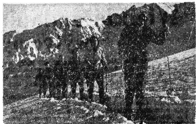
Przyjemnie spędzają czas ludzie pracy na czasach w Zakopanem. Na zdjęciu: Grupa wczasowiczów na wycieczce narciarskiej.