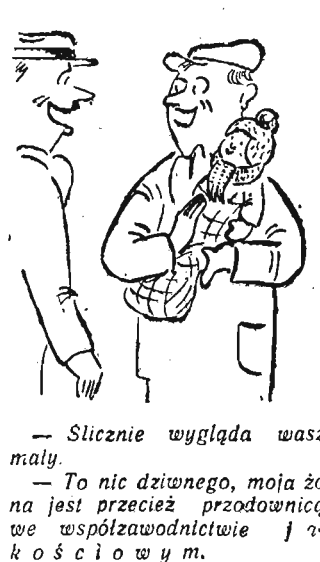
— Slicznie wygląda wasz maly. — To nic dziwnego, moja żona jest przecież przodownicą we współzawodnictwie i r k o ś c i o w y m.

Na włosną organizm jest osłabiony — skutkiem czego odczuwamy przykre znużenie i wyczerpanie, aby temu zapobiec, należy stosować kąpiele ziołowe lub solankowe. Dobrze np. działa kąpiel w wodzie z dodatkiem zwykłej soli kuchennej, którą stosujemy raz na tydzień przez okres miesiąca. Po każdorazowej kąpiele higienicznej (jako zabieg oczyszczający), zmieniamy w wannie wodę i dodajemy kilka (3-4) garstki soli, po czym zanurzamy się po szyję — leżąc spokojnie ok. 20 minut. Po kąpiele nacieramy się grubym ręcznikiem tak długo, dopóki ciało się nie zaróżowi.