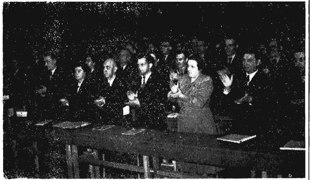
W dniu 17. III. 1954 r. II Zjazd Polskiej Zjednoczonej Partii Robotniczej zakończył obrady.

Na zdjęciu: Manifestacja delegatów na cześć nowo wybranego Komitetu Centralnego Partii.