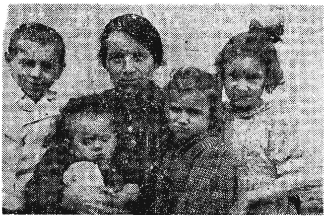
stwo w żłobkach, przedszkolach i szkołach.

trudno, mąż jej jeśli był zatrudniony, ciężko pracował za złotówkę od świtu do nocy. Obecnie jej dzieci pracują, studiuja na wyższych uczelniach, a najmłodsze chodzą do szkoły podstawowej. „Jesteśmy zadowoleni — mówiła Materna — gdyż dzięki władzy ludowej z każdym dniem polepsza się nasz byt. Zamierzamy budować nowy dom, na który otrzymaliśmy już wiele materiałów i długoterminową pożyczkę” Traw.