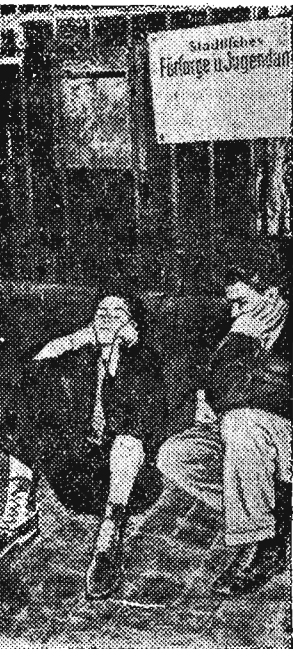
Na zdjęciu: Przed przylutkiem dla bezdomnej młodzieży w Hamburgu. Kto nie ma 50 fenigów na opłacenie noclegu, musi nocować na bruku.