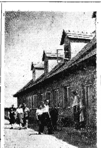
Zrąbwo nasze troszczy się o warunki bytowe nie tylko stałych robotników rolnych w PGR-ach, ale także robotników sezonowych...