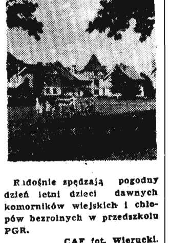
Radośnie spędzają pogodny dzień letni dzieci dawnych komorników wiejskich i chłopów bezrolnych w przedszkolu PGR.

Od samego początku powstania Polski Ludowej do dziś dnia. Wspaniałe maszyny pomagają im dzisiaj w pracy na roli. Dobrze się dzieje chłopom na nowym i z dnia na dzień będzie coraz lepiej.