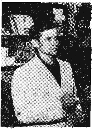
slucha tyczeń swoich klientów.

Na zebraniu koła ZSCH w dniu 6 bm. chłopcy wysunęli go na kandydata do Gromadzkiej Rady Narodowej.