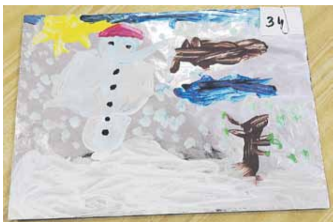
III miejsce w kat. 3-4 lata