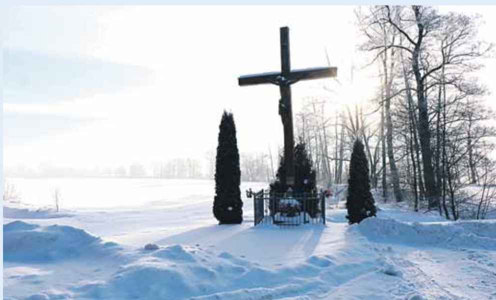
Krzyż w Kraczkowej