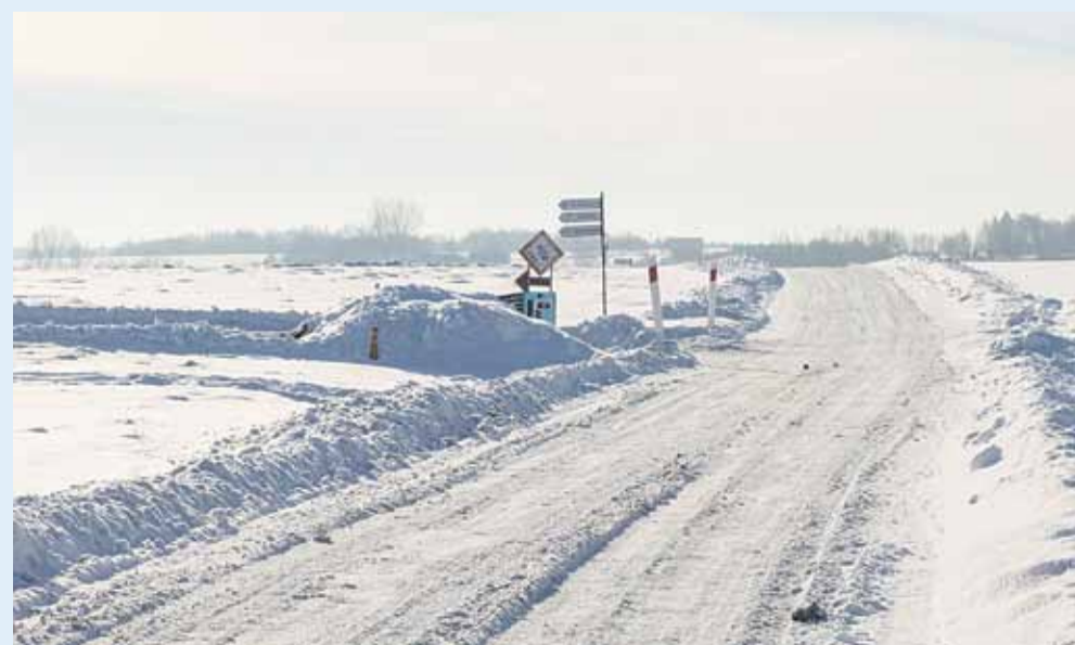
Handzlówka, droga do wyciągu narciarskiego