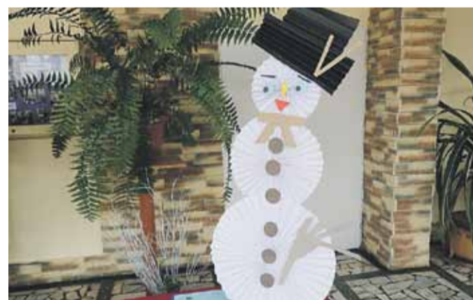
Ozdoby na wystawę prac przygotowała instruktor OK Wysoka Beata Kłak