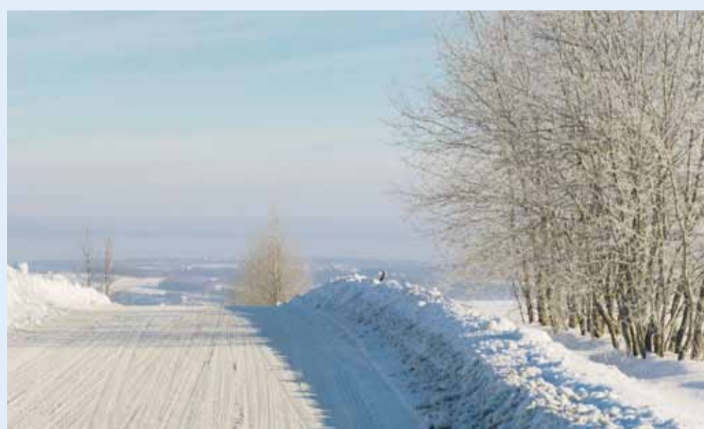
Droga w Cierpiszu Górnym