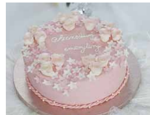
Podczas spotkania nie brakło życzeń, gratulacji i pożegnalnego tortu

tywności zawodowej i społecznej z osobami z niepełnosprawnością. Realizowała się również w pracy z dziećmi, jak i z seniorami. Ma 40 lat. (BB)