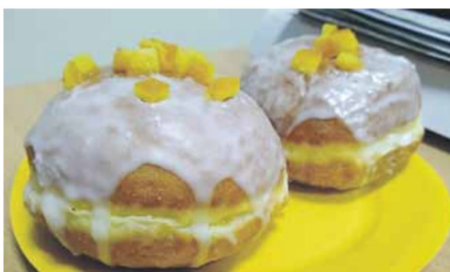
Słodkie pączki mogą być zapożyczeniem z kuchni arabskiej

wina i zagryzanych pączkami. Istnieje legenda o tym, jak tłusty czwartek był nietypowo obchodzony w Krakowie w XVII wieku. Miastem miał rządzić wtedy surowy burmistrz o nazwisku Comber, który nie przepadał za przekupkami handlującymi na krakowskim rynku i skutecznie utrudniał im życie. Ponoć zmarł właśnie w tłusty czwartek, a uradowane handlarzki hucznie świętowały każdą rocznicę jego śmierci. Dziś pączki uchodzą za najpopularniejszy przysmak, spożywany w tłusty czwartek. Według jednego z przesądów, osoba, która tego dnia nie zje ani jednego pączka, będzie cierpieć niepowodzenia przez cały rok. Ciekawostką jest, że początkowo pączki nie były przygotowywane na słodko - słodki pączek jest zapewne zapożyczeniem z kuchni arabskiej. Również w kuchni polskiej pączki miały postać ciasta nadziewanego słoniną, spożywanego przy zapustach. A te, przyrządzane na słodko, zaczęły występować w Polsce w XVI wieku. Na wsi pojawiły się pod koniec XIX i na początku