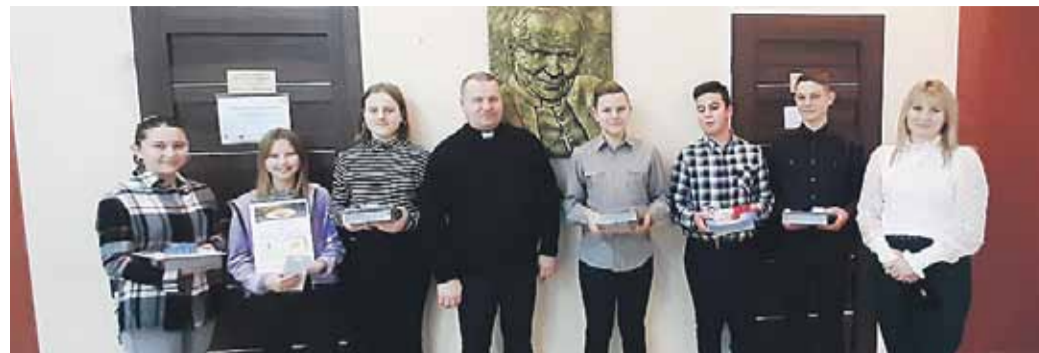
Udział w festiwalu wzięło 45 uczestników