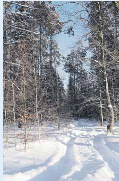
Las w Cierpiszu