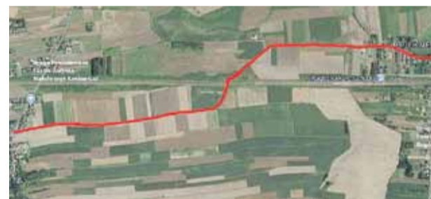
Przebieg planowanej rozbudowy drogi Kosina „Puchałówka” – Rogóżno