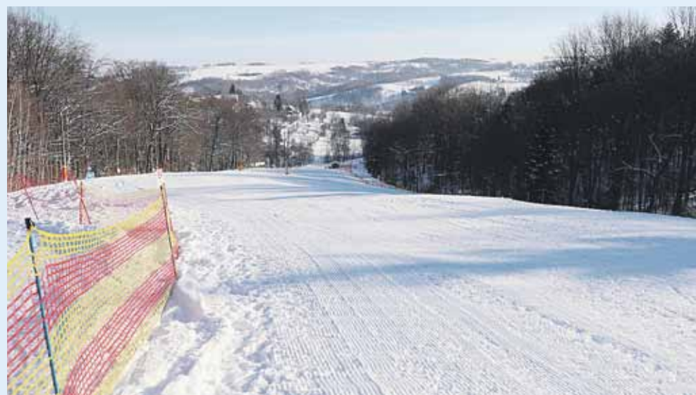
Widok ze stoku