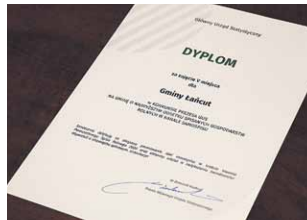
Dyplom i podziękowanie za udział w konkursie

(iw) Otrzymane nagrody