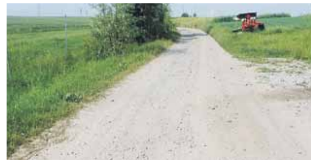
Droga „Puchałówka” w Kosinie

Wykonawca na oba opracowania ma czas do końca sierpnia 2021 roku. Dokumentacja obejmuje m.in. projekty budowlane i wykonawcze, specyfikację techniczną, kosztorys inwestorski. (iw)