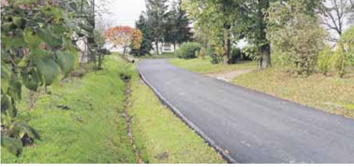
Oświetlenie przy drodze „Poselska” w Kosinie zostanie przebudowane