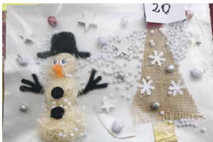
Zwycięska praca w kategorii 3-4 lata