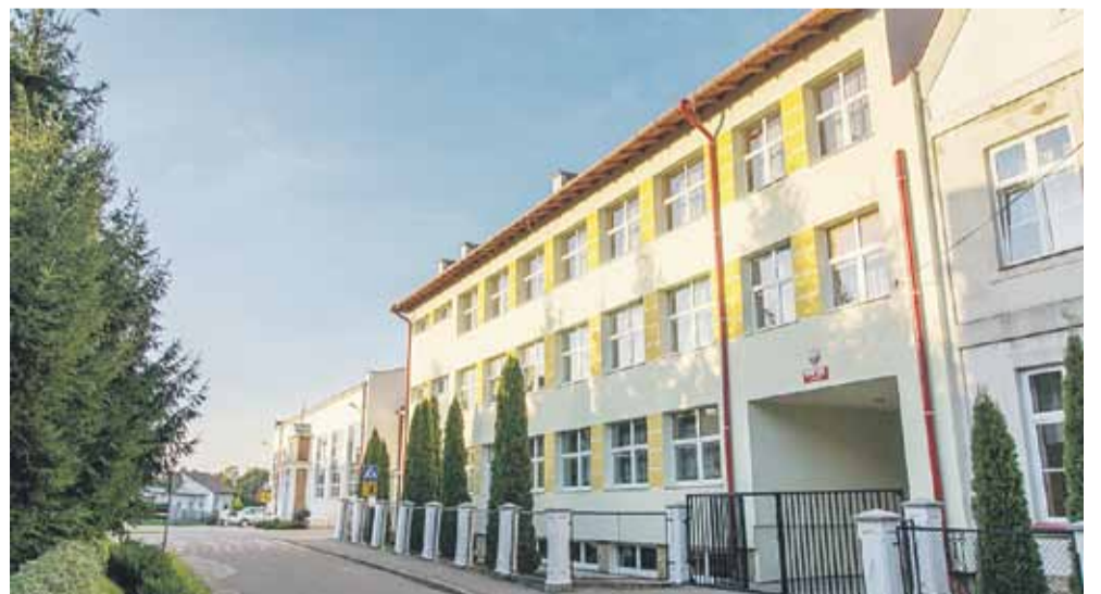
Zespoły szkół działają już w 6 miejscowościach naszej gminy

ma niewielkie znaczenie dla uczniów czy dzieci z przedszkoli, ale pomaga dyrektorom oraz gminie w zarządzaniu placówkami. W przypadku Albigowej podjęcie uchwały było zasadne ze względu na plany budowy nowego przedszkola. Obiekt powstanie przy szkole, całość będzie zarządzana przez jednego dyrektora. Inwestycja przewiduje też utworzenie placu zabaw, miejsc parkingowych oraz rozbudowę kuchni – mówi wójt gminy Łańcut Jakub Czarnota. (iw)