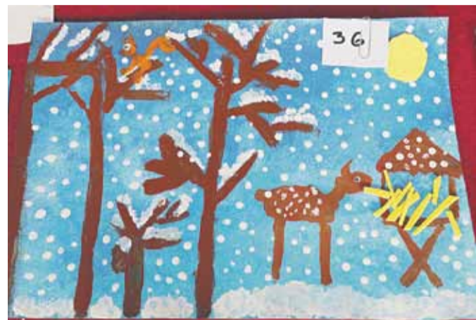
II miejsce w kategorii 5-6 lat