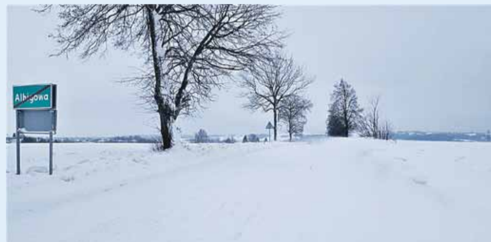
Droga w stronę Markowej