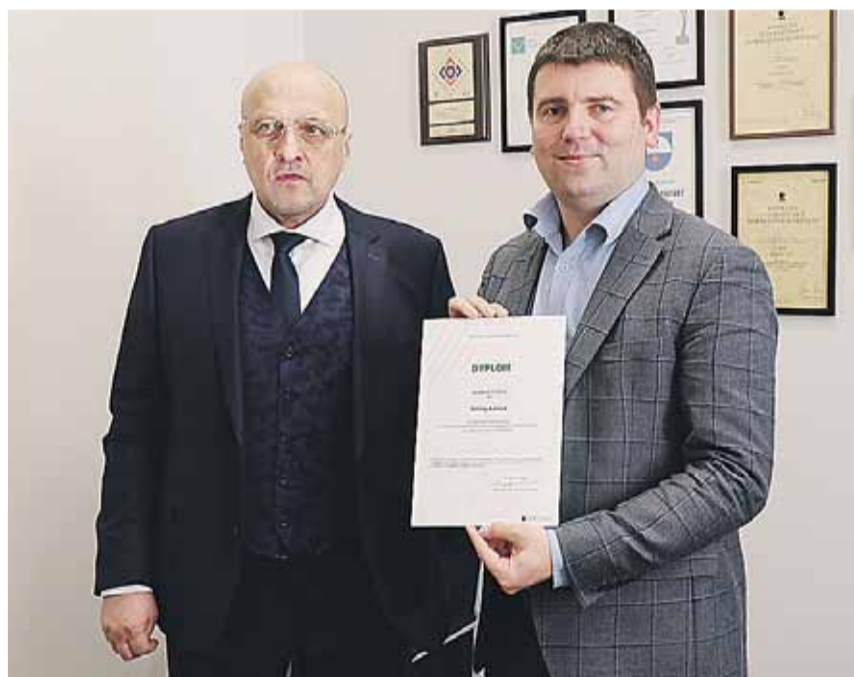
Nagrody do Urzędu Gminy Łańcut dostarczył dyrektor Urzędu Statystycznego w Rzeszowie