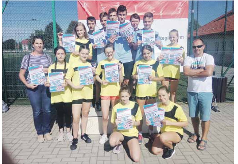
Obecny rok szkolny w Albigowej rozpoczął się wieloma sukcesami uczniów m.in. sportowymi