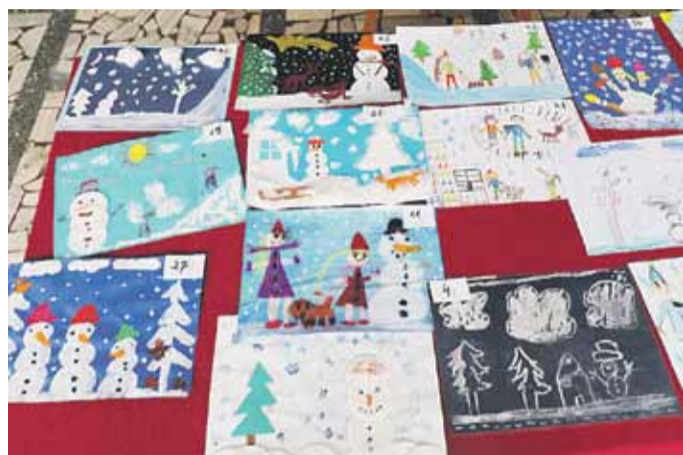
Do konkursu zgłoszono łącznie 87 prac z przedszkoli z terenu gminy Łańcut