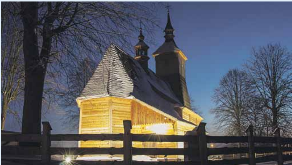
Zabytkowy kościół w Soninie w zimowo-wieczornej odświeżeniu