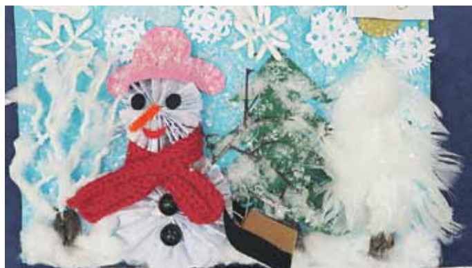
Zwycięska praca w kategorii 5-6 lat