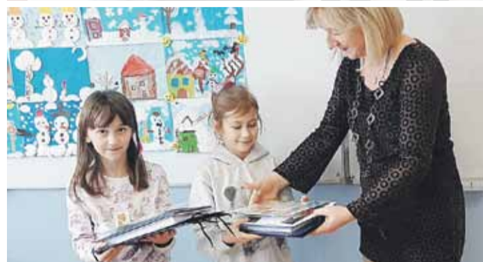
Rozdanie nagród odbyło się w Szkole Podstawowej w Kraczkowej