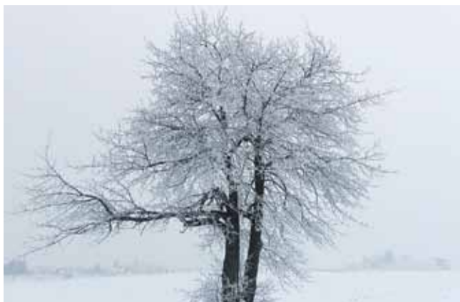
Luty, czyli mroźny, zimowy