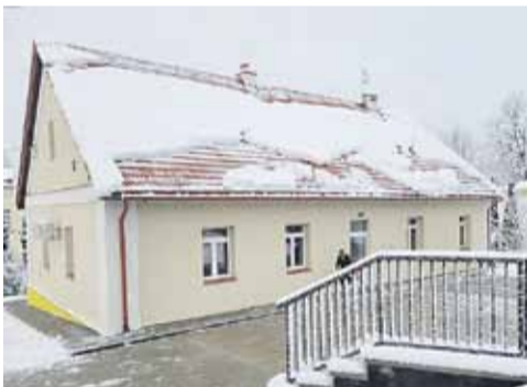
Budynek żłobka w Kraczkowej

Regulamin rekrutacji oraz dokumenty rekrutacyjne można pobrać ze strony internetowej www.gminalancut.pl oraz w Urzędzie Gminy Łańcut, ul. Adama Mickiewicza 24, 37-100 Łańcut w terminie: w ramach Regionalnego Programu Operacyjnego Województwa Podkarpackiego na lata 2014-2020 Osiągnięcie 34 Rozwiązanie opieki żłobkowej w regionie.