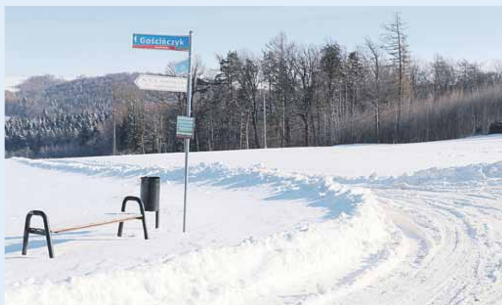
Droga Gościńczyk w Handzlówce