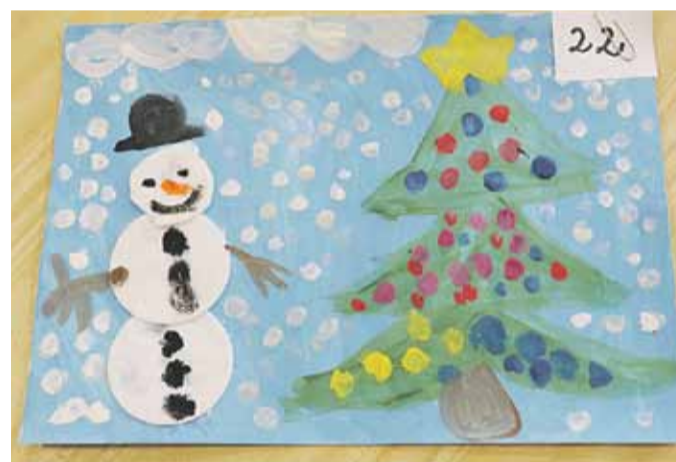
III miejsce w kat. 5-6 lat