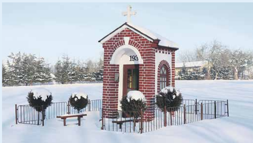
Kapliczka w Kraczkowej