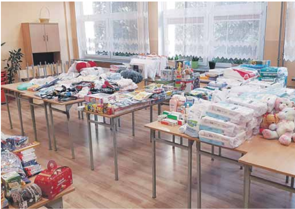
Uczniowie bardzo chętnie angażują się w akcje charytatywne