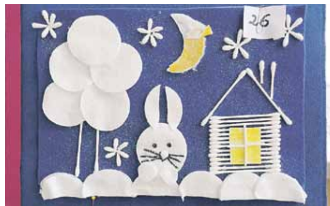
II miejsce w kat. 3-4 lata