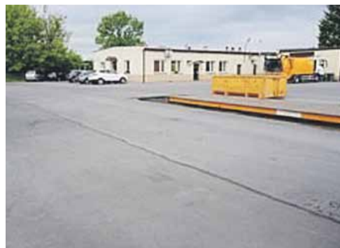
PSZOK działa w poniedziałki, środy oraz piątki od 8 do 17, a także w soboty od 8 do 12

W PSZOK przyjmowane są bezpłatnie następujące frakcje odpadów: opakowania ze szkła, z papieru i tektury, papier, opakowania z tworzyw sztucznych, drewno, zużyty sprzęt elektryczny i elektroniczny, zużyte baterie i akumulatory, meble i inne odpady wielkogabary-