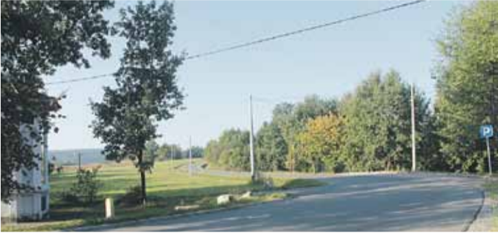
Oświetlenia doczeka się m.in. droga „Działy Wschodnie” w Kraczkowej