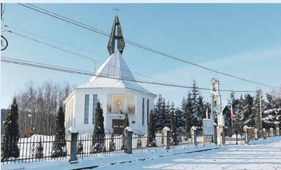
Kościół w Cierpiszu