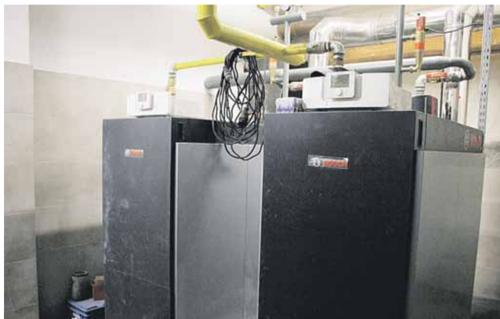
Koszt inwestycji wyniósł ok. 300 tys. zł

Prace obejmowały wymianę istniejących kotłów na paliwo stałe na kotły gazowe, wymianę rozdzielaczy pomp obiegowych, zabezpieczeń instalacji, aparatury kontrolno-pomiarowej, rurociągów w obrębie kotłowni, wykonanie instalacji gazowej do kotłów, montaż kominów stosownie do systemu, roboty wyburzeniowe, murarskie oraz wykończeniowe w celu doprowadzenia kotłowni do standardów ppoż. Zakres objął również roboty elektryczne, pomiary, odbiory, próby i sprawdzenia. (iw)