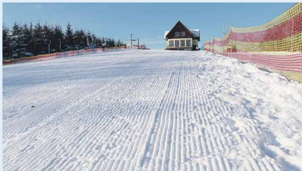
Stok narciarski Staś w Handzlówce jest czynny od 12 lutego