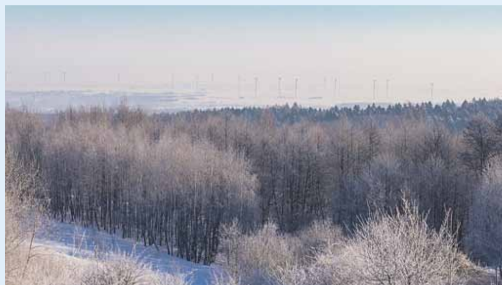
Widok z Cierpisza