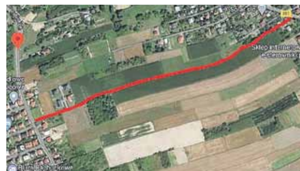
Przebieg planowanej budowy drogi do Soniny