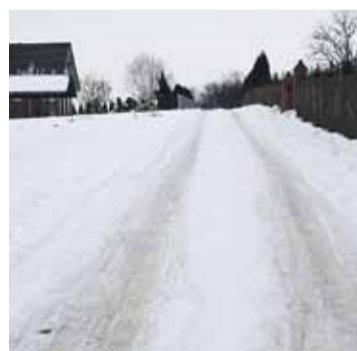
Droga od ul. Potockich w Łañcut