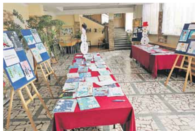
Wystawę można obejrzeć w holu ośrodka