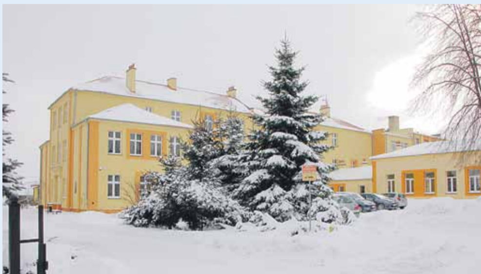
Zimowe otoczenie Zespołu Szkół w Kosinie