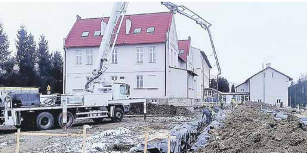
W trakcie wykonywania prac żelbetowych