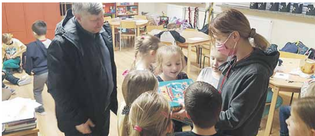
Do szkolnych świetlic i przedszkoli trafiły gry „Akcja segregacja”

Projekt realizuje Stowarzyszenie Seniorów Gminy Łańcut „Aktywny Senior”, które na zadanie otrzymało dofinansowanie z Europejskiego Funduszu Rolnego na rzecz Rozwoju Obszarów Wiejskich w ramach Programu Rozwoju Obszarów Wiejskich 2014-2020, w kwocie 54 tys. zł. Całkowity koszt zadania to 60 486, 05 zł, 10,5 %, czyli 6 351, 05 zł to wkład własny Stowarzyszenia Seniorów. (BB)