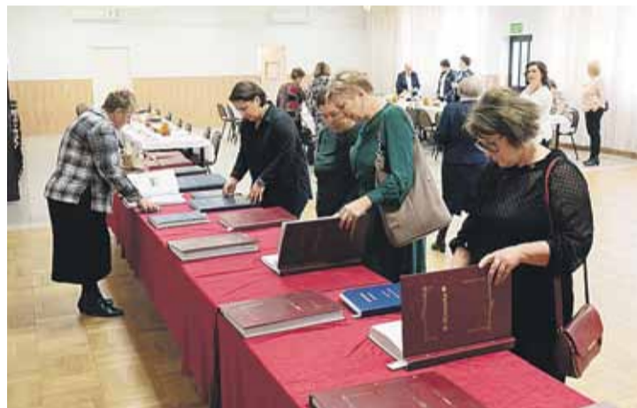
Do konkursu zgłoszono 16 kronik