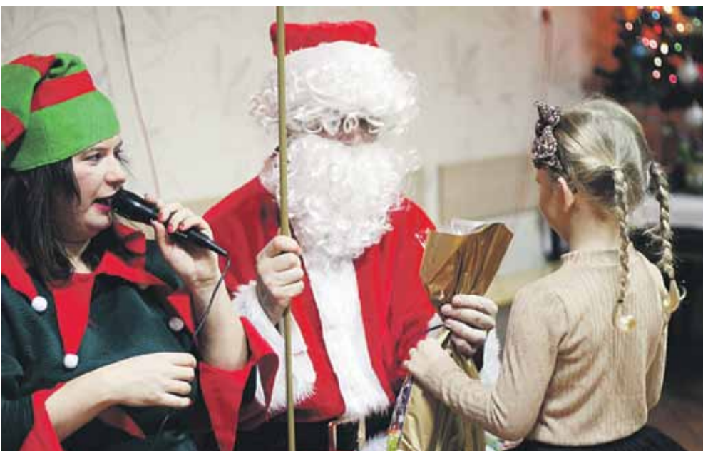
CIERPISZ Ponad 70 dzieci spotkało się 8 grudnia w Ośrodku Kultury w Cierpiszu ze Świętym Mikołajem