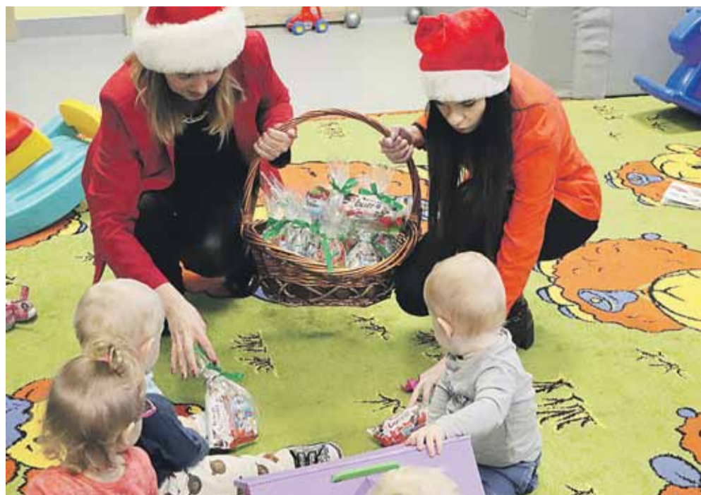
W Gminnym Żłobku w Kosinie