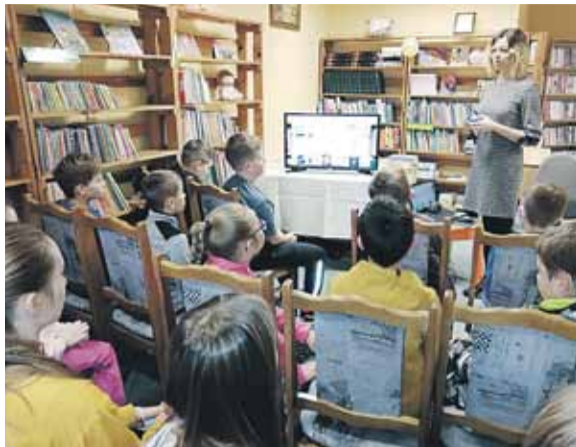
Dzieci dowiedziały się m.in. jak korzystać z elektronicznego katalogu bibliotecznego

W listopadzie miło nam było gościć uczniów z klasy 4 na lekcji bibliotecznej. Głównym celem spotkania było przybliżenie uczniom specyfiki pracy bibliotekarza. Dzieci dowiedziały się co zrobić, żeby zostać czytelnikiem, jak korzystać z księgozbioru oraz z elektronicznego katalogu bibliotecznego.