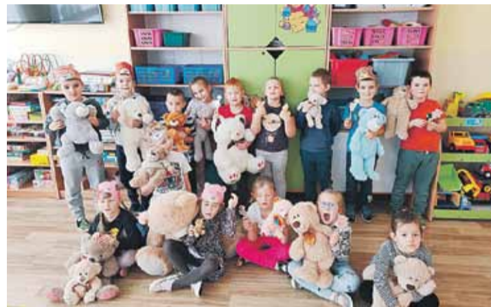
Oprócz ciekawych zajęć edukacyjnych dzieci biorą udział w wycieczkach, konkursach oraz imprezach okolicznościowych

kursach organizowanych przez szkołę oraz przez wychowawców grupy. Ostatnim z nich był konkurs plastyczny pt. „Święty Mikołaj- patron dobroci i miłości”. Zostali wyłonieni zwycięzcy, wręczono dyplomy i nagrody. Czas spędzony w naszym przedszkolu to czas nauki, zabawy, ale przede wszystkim szansa na