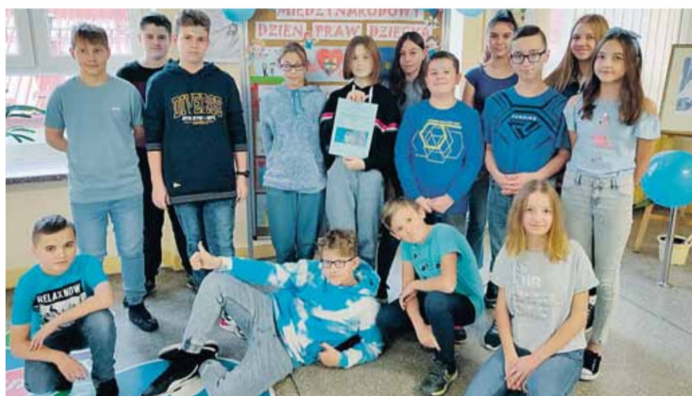
Wszyscy uczniowie oraz nauczyciele przyszli tego dnia ubrani w kolorze niebieskim