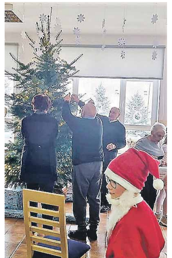
Wspólnymi siłami ubierali choinkę. W Ośrodku są jeszcze wolne miejsca. Szczegóły pod nr tel.: (17) 224-60-92 lub 781-600-708. (iw)

Wiary, która odmieni nasze serca, Nadziei, że jutro będzie lepsze, Miłości, która przetrwa najgorsze momenty w życiu. I zdrowia, którego wszyscy potrzebujemy. Wesołych świąt Bożego Narodzenia!