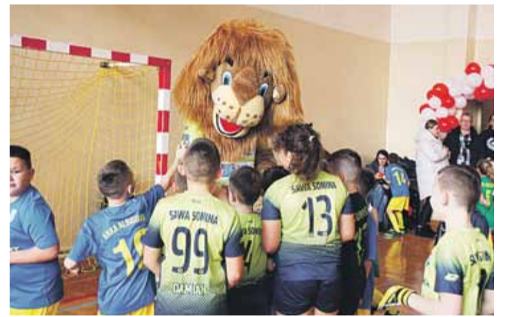
Nie zabrakło maskotki Klubu LKS „Dąb” Kosina