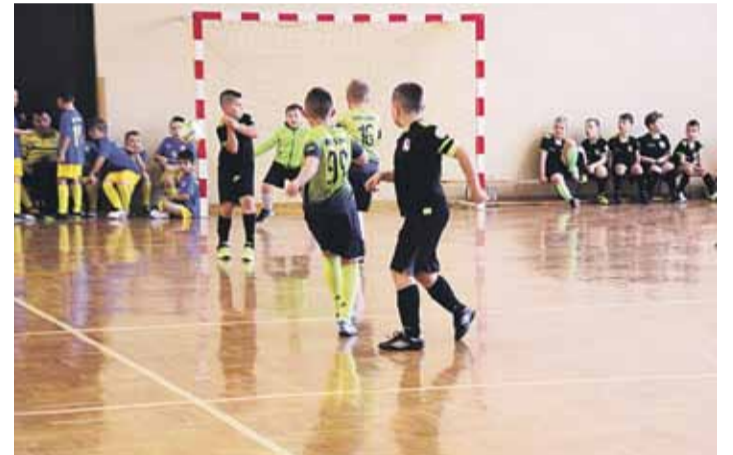
Była rywalizacja i dobra zabawa