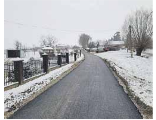
GINA ŁAŃCUT. Kolejne drogi wewnętrzne zostały przebudowane. Na zdjęciach droga Spółdzielcza w Głuchowie przed i po realizacji