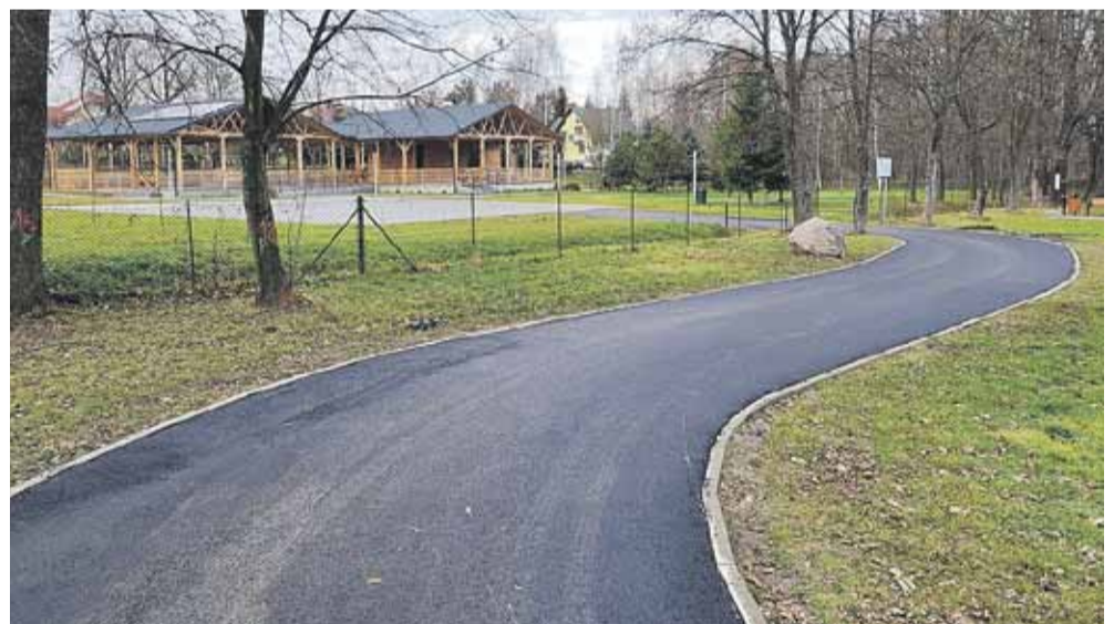
Asfalt pojawił się także na drodze do sceny plenerowej w Soninie