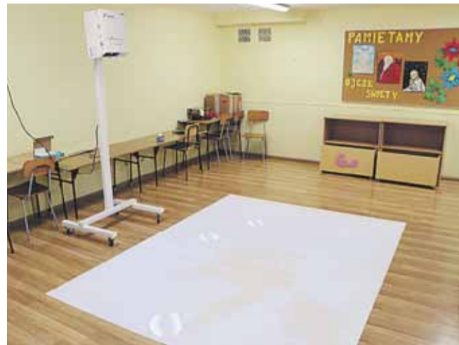
Najciekawszą atrakcją była jednak podłoga interaktywna