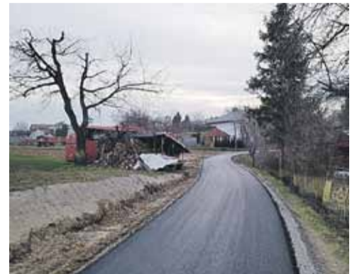
Łącznik Mołędówki i Ścieżek w Kosinie gotowy. Na zdjęciach droga przed i po realizacji