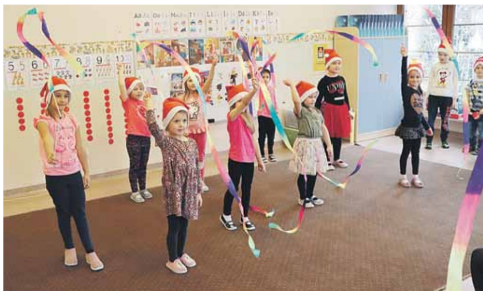
Występ przedszkolaków z Soniny