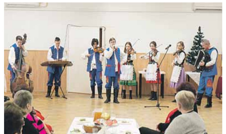
Podczas wydarzenia wystąpiła Młodzieżowa Kapela Ludowa

Spośród zgłoszonych do Konkursu Komisja postanowiła dodatkowo wyróżnić kroniki Kół z Albigowej-Honie, Białobrzeg, Brzozy Stadnickiej, Cierpisha i Wysokiej. Na pamiątkę udziału w konkursie Koła otrzymały dyplomy i kalendarze ścienne, a przewodniczą-