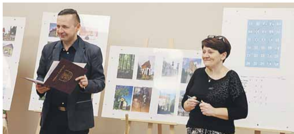
Konkurs poprowadzili pracownicy Centrum Kultury Gminy Łańcut. Uczestnicy otrzymali nagrody i poczęstunek