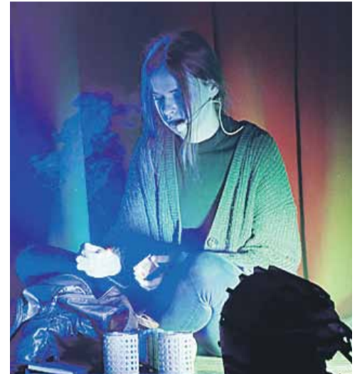
Spektakl składał się także z utworów muzycznych i wierszy