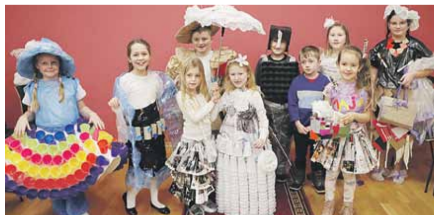
Eko Stroje oceniała komisja konkursowa, która przyznała 3 główne nagrody. Pierwsza z nich została sfinansowana w ramach projektu, pozostałe zostały ufundowane przez Gminę Łańcut.