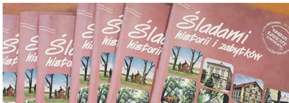
Folder „Śladami historii i zabytków” jest jednym z czterech wydanych przez Gminę Łańcut w ramach projektu „Poznajemy lokalne dziedzictwo poprzez wydanie publikacji oraz organizację wydarzeń promujących obszar LGD Ziemia Łańcucka”