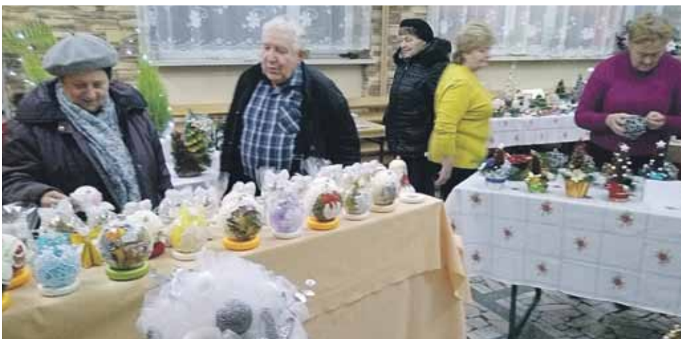
Wystawa trwała przez 3 dni w Ośrodku Kultury