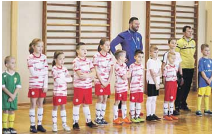
Drużyna z Wysokiej