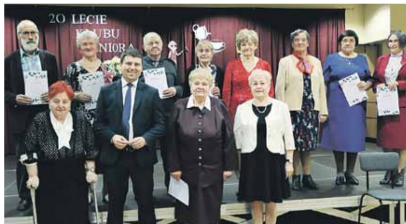
Koło działa od 26 listopada 2000 roku

Koło organizuje: spotkania noworoczno-opłatkowe, spotkania z okazji dnia seniora, z okazji dnia chorego, pielgrzymki i wycieczki, spotkania modlitewne w Dolinie Miłosierdzia w Kraczkowej, a także współpracuje z innymi kołami z terenu gminy Łańcut, angażuje się w projekty realizowane przez Stowarzyszenie Seniorów Gminy Łańcut „Aktywny Senior”. Maria Grzywa, red.