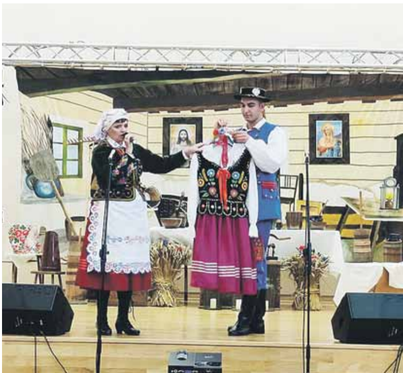
Dzieci poznały regionalne zwyczaje w myśl słów S. Jachowicza „Cudze chwalicie, swego nie znacie, sami nie wiecie co posiadacie”