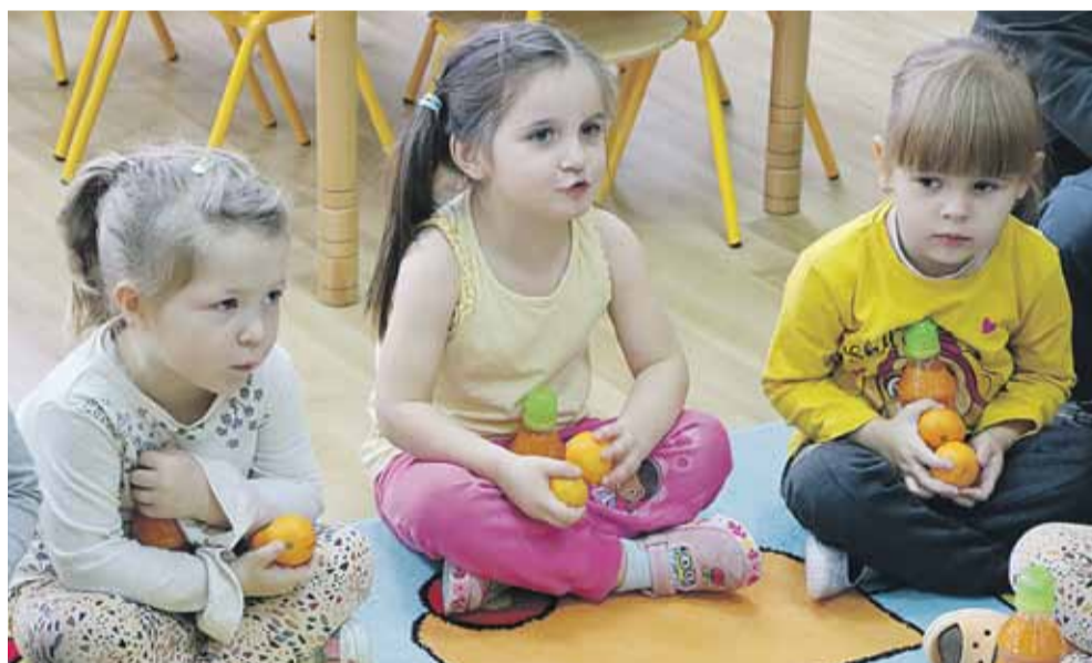
Dzieci rozmawiały z wójtem o św. Mikołaju i świętach Bożego Narodzenia