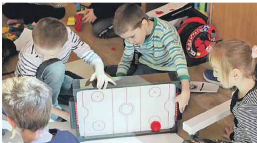
Nowe zabawki sprawiły dzieciom dużo radości.