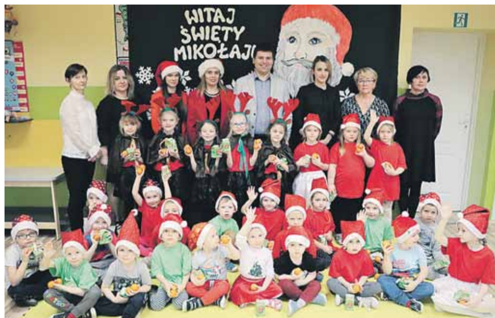
Nie zabrakło pięknych mikołajkowych strojów. Na zdjęciu dzieci z przedszkola w Głuchowie