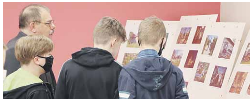
Wystawa przedstawiała zabytki z terenu Lokalnej Grupy Działania „Ziemia Łańcucka” – gminy: Łańcut, Rakszawa, Białobrzegi, Żółtyń, Grodzisko Dolne.

społeczność” objętego PROW na lata 2014-2020. Łącznie w ramach projektu powstały cztery foldery, które zawierają: informacje o znanych postaciach (folder „Śladami niezwykłych mieszkańców”); informacje o szlakach rowerowych, ścieżkach spacerowych i edukacyjnych (folder „Śladami miejsc wyjątkowych”); przepisy na tradycyjne lokalne potrawy (folder „Śladami tradycji i smaku”); informacje na temat historii i zabytków (folder „Śladami historii i zabytków”). Zorganizowane zostały także cztery imprezy - Festyn Międzypokoleniowy w Kosinie (15 sierpnia); Piknik kulinarny z tradycją w Wysokiej (25 września); Spacer przez Handzlówkę (2 października); Wystawa historyczna w Soninie (14 grudnia). (BB)