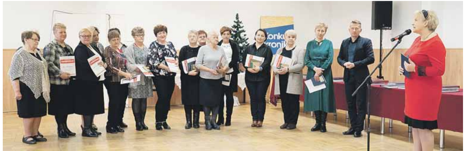
Tegoroczny konkurs kronik odbył się już po raz 13

Komisja konkursowa oceniając kroniki podkreśliła, że „wszystkie, biorące udział kroniki zachwycają profesjonalizmem oraz wysokim poziomem merytorycznym zapisów dokumentacyjnych. Kronikarze dokumentują swoją działalność słowem, grafiką, fotografią. Wszystkie kroniki przyczyniają się do tworzenia regionalnego dziedzictwa kulturowego i zapisują historię swojego otoczenia. W każdej można znaleźć coś wyjątkowego i wszystkie mają ogromne wartości poznawcze i dokumentacyjne. Komisja dziękuje organizatorom za przygotowanie tak pożytecznego Konkursu, sugeruje jego kontynuację oraz wzbogacanie go o formy rozszerzające wiedzę i umiejętności prowadzenia działań dokumentacyjnych w Kołach. Wszystkie kroniki są piękne i zasługują na wysoką ocenę”.