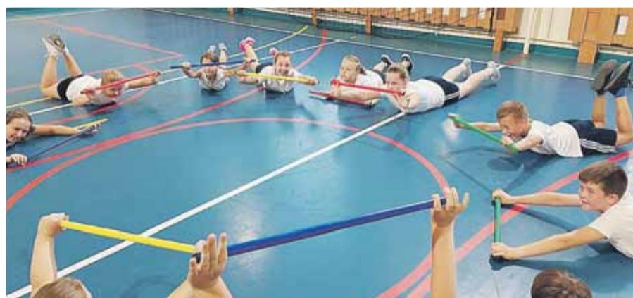
Zajęcia cieszyły się dużym zainteresowaniem dzieci

to szczególnie ważne po kilku miesiącach nauki zdalnej, która miała niekorzystny wpływ nie tylko na rozwój ruchowy dzieci. Ćwiczenia wpływały korzystnie na kształtowanie ogólnej sprawności uczniów, wzmacniały siłę mięśniową, poprawiały gibkość, skoczność, szybkość