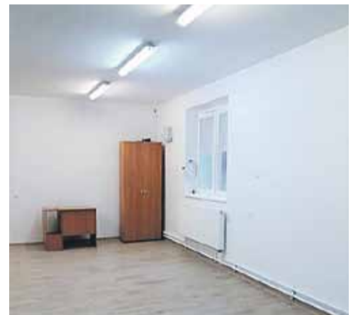
Tak wygląda sala widowiskowa w Rogóżnie po gruntownym remoncie