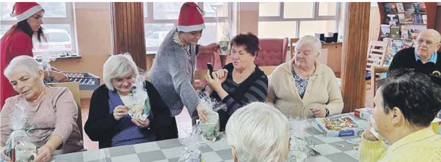
W Ośrodku Opieki Diennej w Wysokiej Pogodny Senior od początku grudnia czuć świąteczny klimat. U Seniorów był Mikołaj, odwiedzili ich także uczniowie Zespołu Szkolno-Przedszkolnego w Wysokiej.