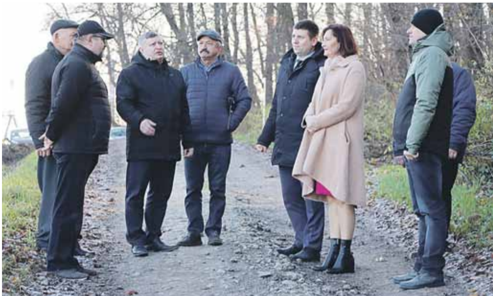
Wojewoda odwiedziła także teren budowy drogi Albigowa Granice, która połączy centrum wsi z Markową. Realizacja inwestycji zakończy się 2023 roku.