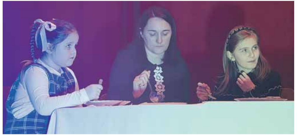
W scenariuszu do spektaklu pojawiła się scena wigilii