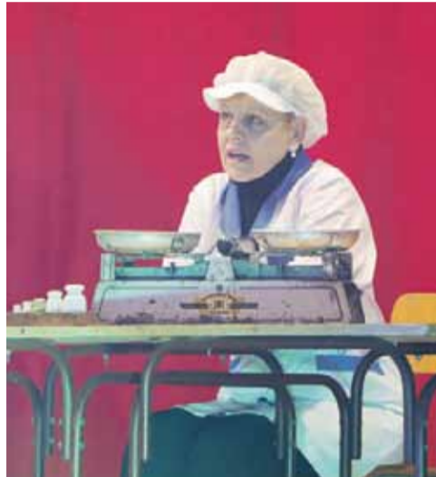
Nie zabrakło sceny ukazującej zakupy w tamtych czasach