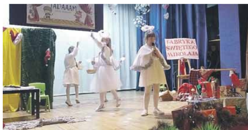
Przed wizytą Mikołaja wystąpiła grupa teatralna „TADAAAM”