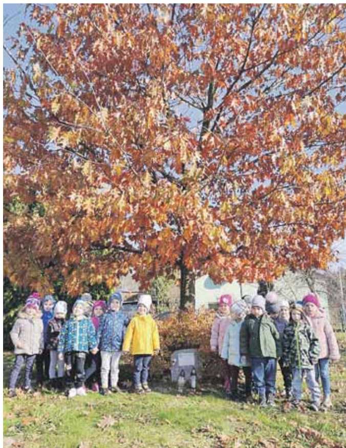
Zapaliły także światełko pod dębami pamięci sonińskich bohaterów

SONINA 28 października dzieci z Przedszkola Publicznego w Soninie z grup Leśne Duszki, Smerfy, Florianki i Słoneczka wzięły udział w akcji #szkołapamięta.