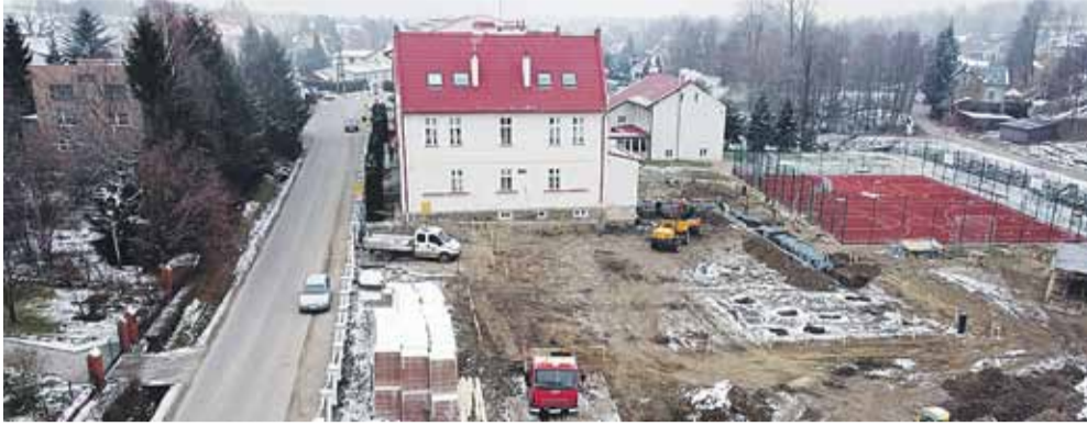
Plac budowy z lotu ptaka