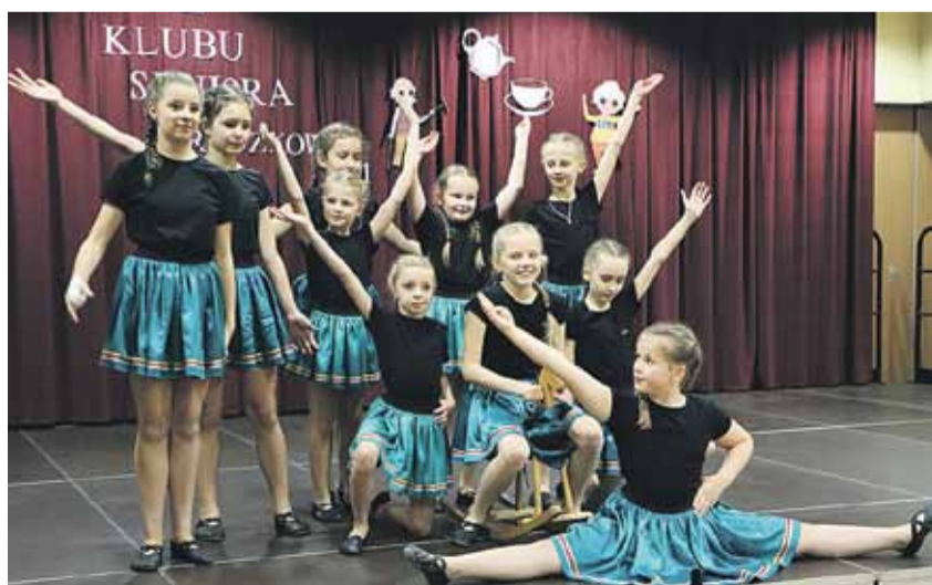
Podczas jubileuszu wystąpił Zespół taneczny Contrast