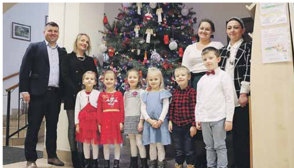
Na parterze Urzędu Gminy Łańcut stoi piękna choinka, którą ubrały dzieci z Publicznego Przedszkola w Soninie. Przedszkolaki przy okazji odwiedziły gabinet wójta. Na koniec wizyty pod choinką znalazły prezent – podłogę interaktywną