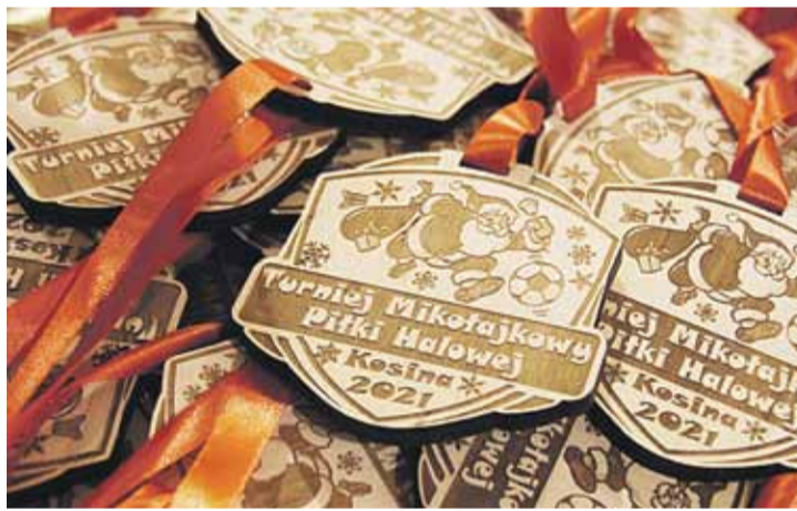
Wszyscy zawodnicy otrzymali takie pamiątkowe medale