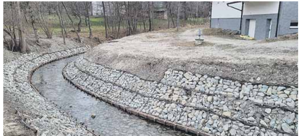
Na zdjęciu efekt działań Wód Polskich

ALBIGOWA/HANDZLÓWKA Dobiegł końca kolejny etap naprawy wyrw na Sawie powstałych w wyniku powodzi w 2020 r. i wcześniejszych zdarzeń oraz udrażniania rzeki na odcinkach w Albigowej i Handzlówce.