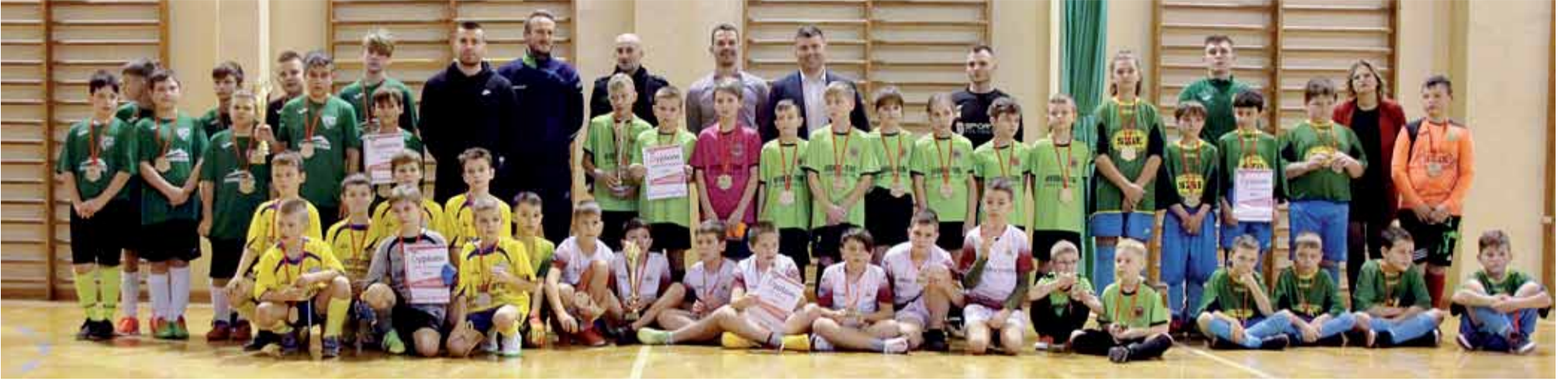
Wszyscy uczestnicy turnieju

GMINA ŁAŃCUT Od początku grudnia Święty Mikołaj ma wyjątkowo dużo pracy, ale pomimo natłoku obowiązków znalazł czas, by odwiedzić najmłodszych piłkarzy Gminy Łañcut.