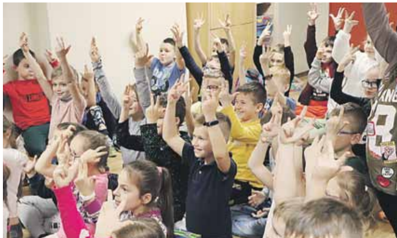
Na świetlicach nie ma nudy. Oprócz zabawy jest także nauka. W Albigowej dzieci nauczyły się kolędy „Cicha noc” w języku migowym