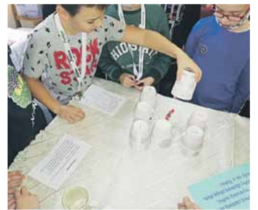
Uczestnicy o tym, co czeka ich w przyszłości próbowali się dowiedzieć korzystając z: kubków, szpilek, butów, kolorowych kartoników, butelki, serduszek i kostek

Wszystkie spotkania stanowiły doskonałą okazję do dobrej zabawy oraz do