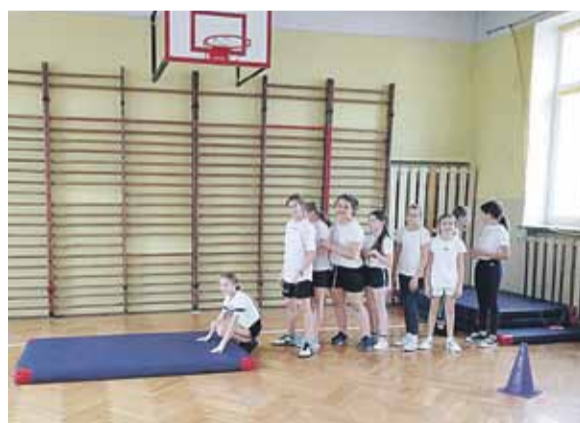
Łącznie w programie wzięło udział 150 uczniów szkół podstawowych

Celem programu była poprawa ogólnej kondycji, rozwijanie sprawności ruchowej jego uczestników, wzmocnienie mięśni, szczególnie kręgosłupa. Stało się