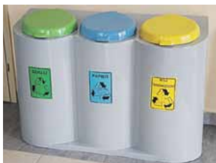
Takie kosze do segregacji pojawią się w każdym ośrodku kultury