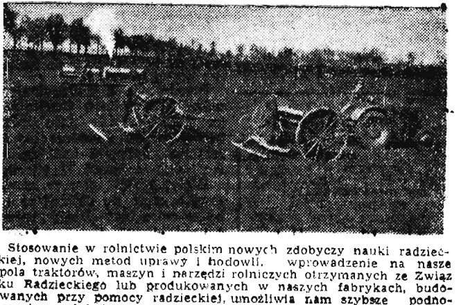
SIEW KRZYŻOWY NA POLU PGR Stosowanie w rolnictwie polskim nowych zdobyczy nauki radzieckiej, nowych metod uprawy i hodowli, wprowadzenie na nasze pola traktorów, maszyn i narzędzi rolniczych otrzymanych ze Związku Radzieckiego lub produkowanych w naszych fabrykach, budowanych przy pomocy radzieckiej, umożliwiła nam szybsze podnoszenie produkcji rolnej i hodowlanej.

pilo to jakieś nieporozumienie. Czy Wy towarzysze uważacie, że po to opisałem sprawę Długosz, aby Wam „poderwać autorytet”, aby Wam szkodzić? Nic podobnego, Chciałem Wam pomóc. Nie pisałem artykułu dla samego pisania i pisać, miałem fakty zebrane u Was. Złe jest, że nie chcecie przyznać samokrytycznie słusznych zarzutów pod Waszym adresem i napisaliście wyjaśnienie niewiele wyjaśniające całą sprawę. Jest faktem, że Długosz pracuje na dawnym miejscu,