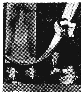
Na zdjęciu: Fragment prezydium uroczystej akademii która odbyła się w Rzeszowie