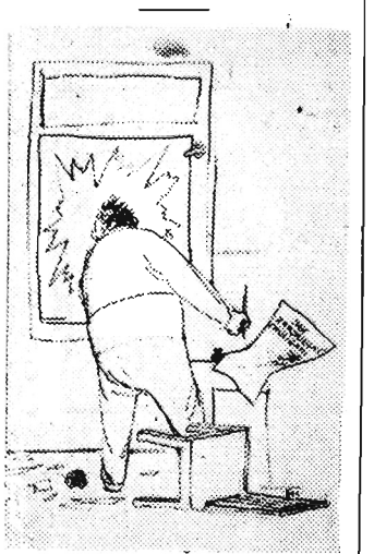
Nie możesz, smarkaczu, iść do sąsiada, zamiast przeskadzać ojcu?!... rys. Szymon Kobylński

LONDYN (PAP). Jak donosi agencja Reutera, dnia 9 bm. nastąpiła silna eksplozja amunicji na jednym z okrętów czangkajszekowskich. Wskutek eksplozji 7 osób poniosło śmierć, zaś 3 osoby zostały ranne.