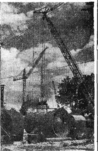
Na zdjęciu: Fragment stołsa ciężkiego sprzętu budowlanego CAF