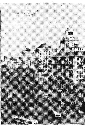
Na zdjęciu: Główna ulica Kijowa — Kreszczatki.