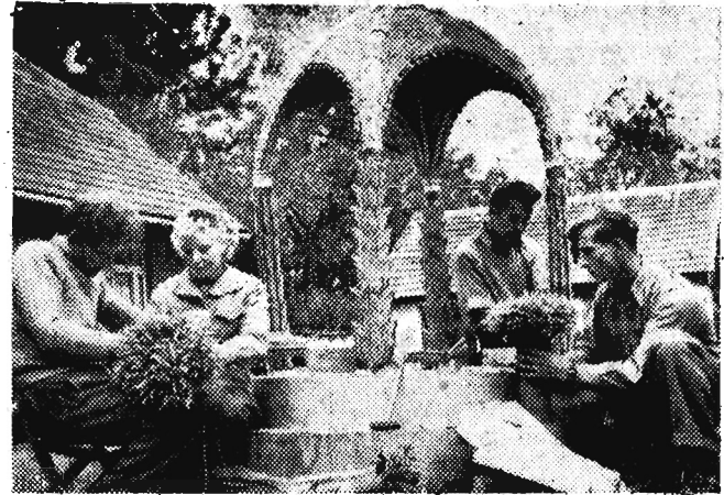
Przy pracy nad wieńcem dożynkowym robota pali się w rękach