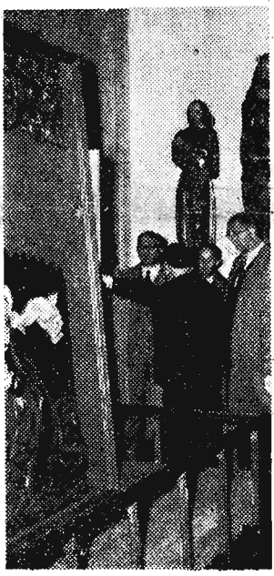
14 bm. bawili w naszym kraju na zaproszenie polskiej grupy Unii Międzyparlamentarnej senator Stanów Zjednoczonych Ameryki z ramienia partii demokratycznej — Estes Kefauver oraz członek brytyjskiej Izby Gmin z ramienia partii konserwatywnej, Sędzia Pokoju — Cyryl Osborne wiedzili Kraków, Nową Hutę i Osowicę. Na zdjęciu: Senator Kefauver, poseł Osborne na Wawelu.