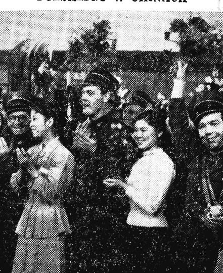
Na zdjęciu: Serdeczne powitanie na dworcu w Pekinie.