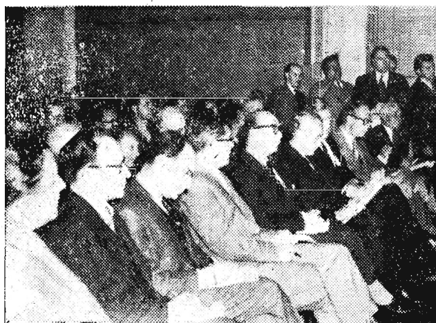
Na zdjęciu: Podczas konferencji prasowej u rzecznika radzieckiego L. F. Iljczowa.