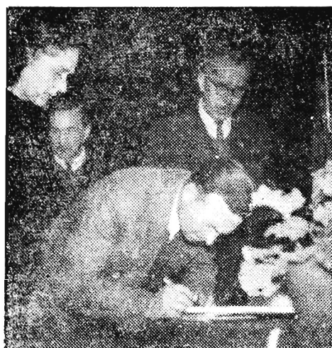
Mgr Bał oczekuje tylko na zakończenie podpisywania oficjalnych dokumentów, aby odebrać cenną nagrodę. Wielki zaszczyt spotkał chłopów z krosnieńskiego, zaszczyt, który zobowiązuje do jeszcze lepszej pracy.

Tekst — J. FILIPOWICZ