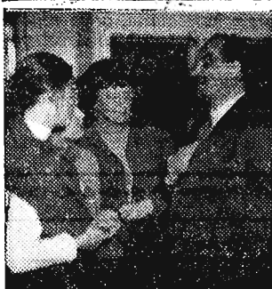
28. XI. 1955 r. goście zagraniczni z Indii, Turcji, Egiptu i Chin, przybyli do Warszawy na uroczystości mickiewiczowskie.