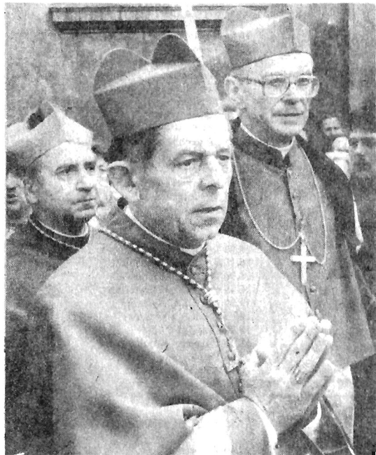
Kardynał Józef Glemp, uczestnik uroczystości.