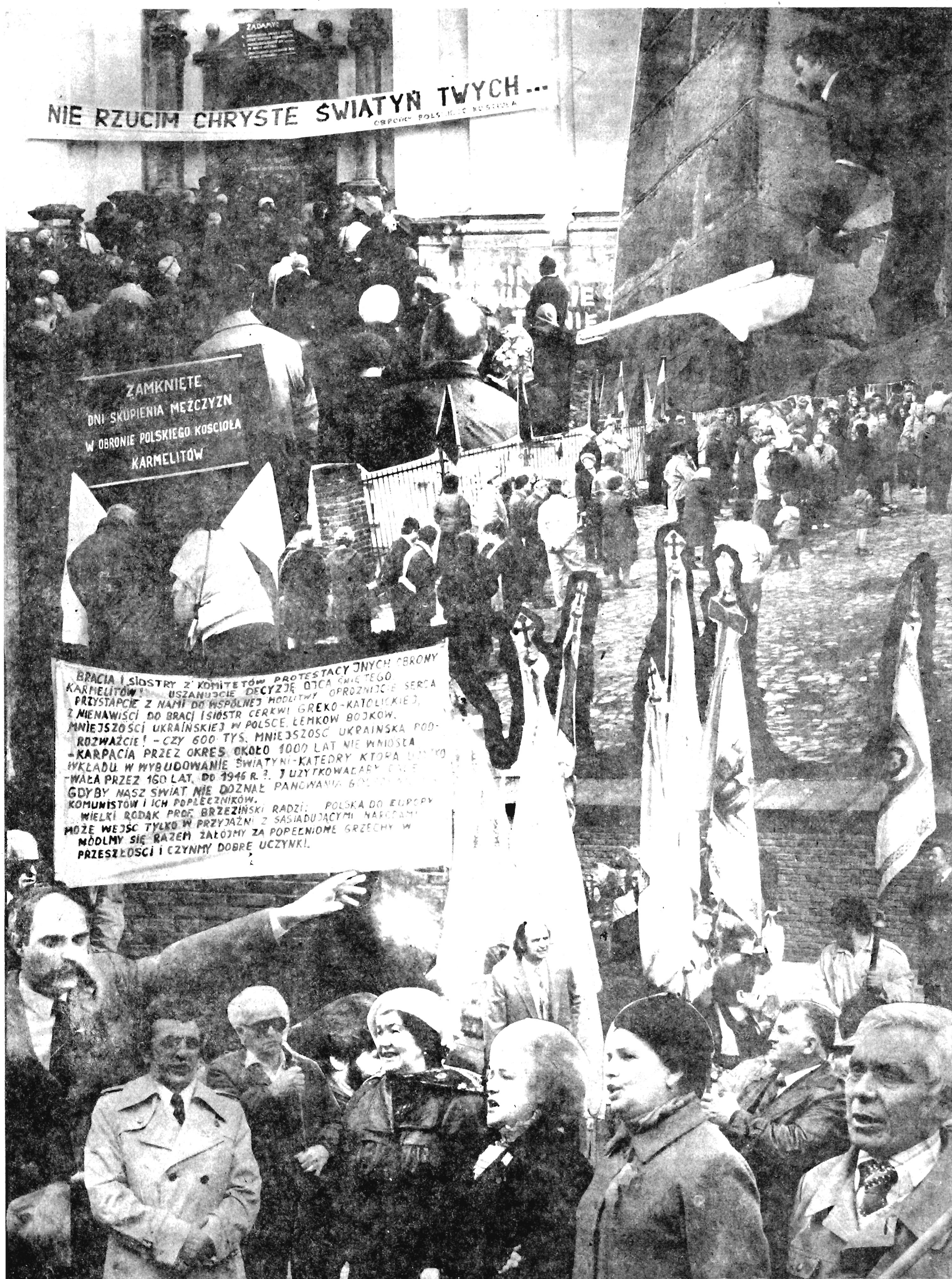
Przemyśl — 11 do 14 kwietnia 1991 r.