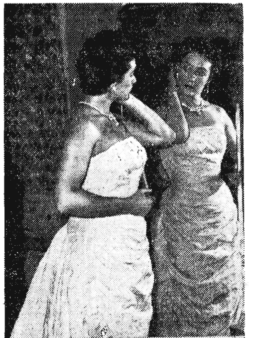
Dom Towarowy w Ostrawie urządził wielki pokaz modeli gotowych sukien.

Zdaniem agencji United Press „jednym z najbardziej palących problemów omawianych na konferencji jest sprawa Jordanii, która do niedawna należała do zdecydowanych sojuszników Anglii na Środkowym Wschodzie...”. UP stwierdza, że miast angielskiego generała Templera, który usiłował zmusić Jordanie, by przystąpiła do paktu bagdadzkiego, haniebnie zawiedła”.