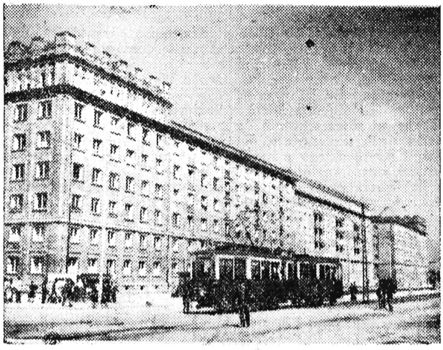
W NOWEJ HUCIE Na zdjęciu: Fragment osiedla A-1.

Dekret stwierdza, że czynne prawo wyborcze mają Tunizyjscy, którzy w dniu wyborów będą mieli ukończonych 21 lat. Wybory będą powszechne i bezpośrednie. Bierne prawo wyborcze mają umiejscowieni w kraju obywatele tunijscy od lat 25.