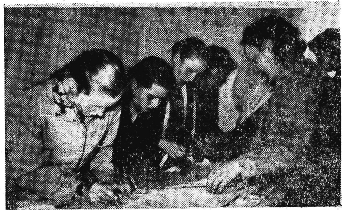
W Czudcu uczą się kroju i szycia.