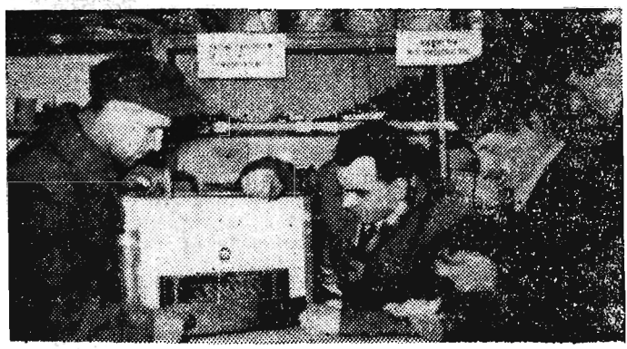
Z ciekawością oglądają chłopci aparat radiowy „Syręną”.