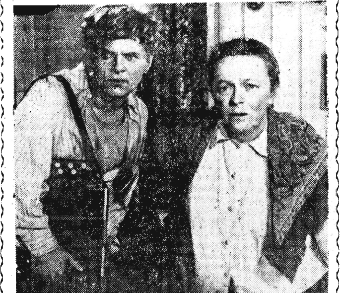
Od 20 bm. na ekran kina „Apollo” w Rzeszowie wejdzie kolorowy film prod. radzieckiej pt. „Szeregowiec Browkin”. Jest to interesująca komedia filmowa. Na zdjęciu: scena z filmu.