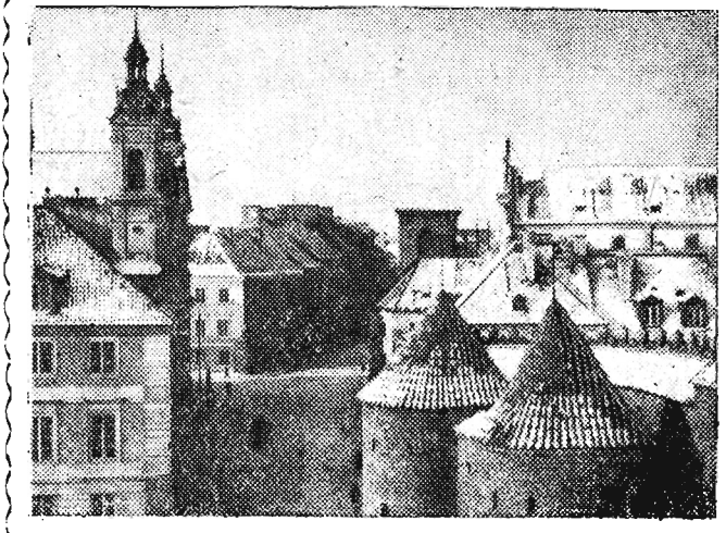
WARSZAWA W SNIEGU Na zdjęciu: Widok przez Barbakan na ulicę Freta na Nowym Mieście.

(r) 70 proc. ogólnej ilości na wozów sztucznych przydzielonych na potrzeby naszego województwa znajduje się już w magazynach GS. Pierwszeństwo w zakupowaniu nawozów mają spółdzielnie produkcyjne, chłopie kontraktujący oraz ci, którzy sprzedali państwu zboże po cenach wolnorynkowych. Dotychczas sprzedaż nawozów najlepiej przebiega w powiatach niżańskim, rzeszowskim i mieleckim.