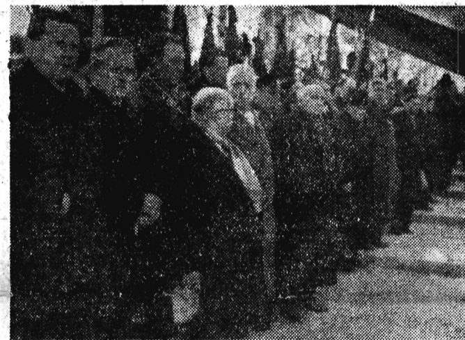
Na Cmentarzu Wojskowym — członkowie delegacji zagranicznych przy grobie Bolesława Bieruta.

Wiceprezes Rady Ministrów i minister Obrony Narodowej Konstanty Rokossowski Marszałek Polski