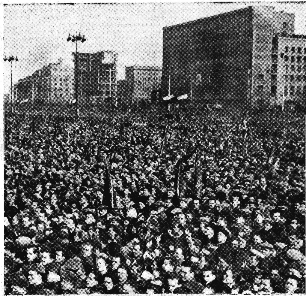
Na Placu Stalina podczas zgromadzenia żałobnego.