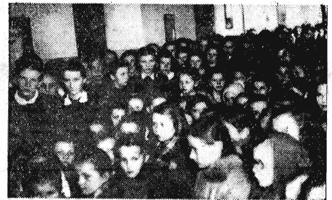
Uczennice Żeńskiej Szkoły Ogólnokształcącej w Rzeszowie w skupieniu słuchały audycji z uroczystości pogrzebowych.