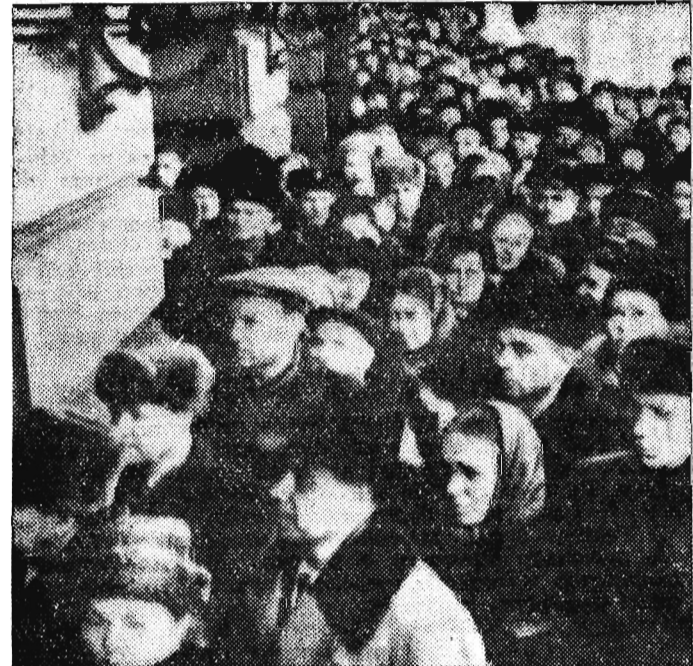
Na zdjęciu: Tysięczne rzesze ludności w skupieniu oczekują przed gmachem KC PZPR, by złożyć pożegnalny hołd Towarzysowi Bolesławowi Bierutowi.