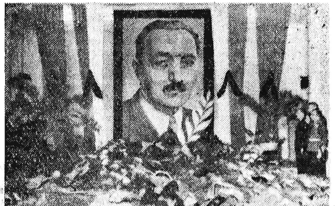
W dniu 16 bieżącego miesiąca w sali kolumnowej KW PZPR przed portretem Towarzysza Bieruta liczne delegacje z miasta i całego województwa złożyły wieńce, oddając hołd Zmarłemu.