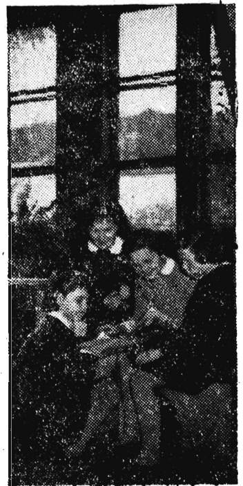
Na zdjęciu: W wolnym czasie...

W Państwowym Domu Młodzieży „Koliba“ w Zakopanem wychowuje się 69 dziewcząt.