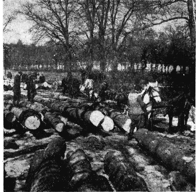
Na zdjęciu: Wywóz drewna z nadleśnictwa PRAŁKOWCE — w Rzeszowskim Okręgu Lasów Państwowych. Okręg ten wykonał plan wywózki drewna za I kwartał b. roku mimo ciężkich warunków atmosferycznych jakie panowały tej chwili na Podkarpaciu.

W RZYMIE ODKRYTO NOWE KATAKUMBY W Rzymie odkryto nowe katakumby, pochodzące z czasów wczesnego chrześcijaństwa. Ciągła się one pod ziemią, w pobliżu starożytnego drogi Via Latina. Ściany katakumb ozdobił szereg malowideł i fresków o tematyce staro- i nowotestamentowej.