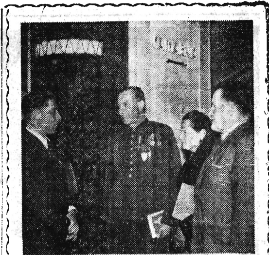
Dnia 7 kwietnia 1956 r. w Pałacu Kultury i Nauki w Warszawie rozpoczął 4-dniowe obrady II Kongres Spółdzielczości Zaopatrzenia i Zbytu.

(e) Pomyślne wyniki w realizacji planu za I kwartał br. uzyskała załoga Huty Stalowa Wola. Plan produkcji globalnej wykonano w 103,4 proc., plan produk-