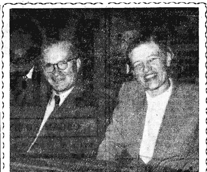
Na zdjęciu: Minister Sprawiedliwości Zofia Wasilkowska w rozmowie z Generalnym Prokuratorem Marianem Rybickim.

problemów międzynarodowych. W tych warunkach narody nie powinny osiadać swej czujności i gotowości walki o pokój, przeciwko groźbie nowej wojny.