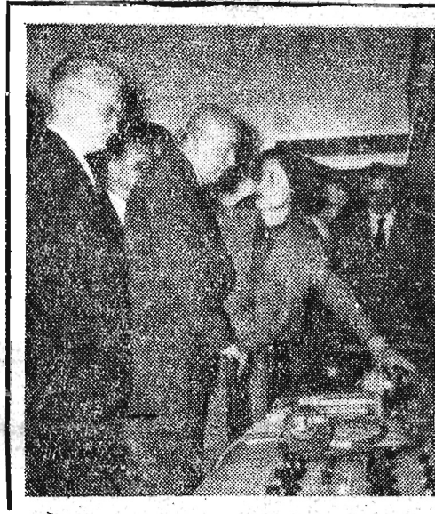
Warszawska stacja telewizyjna w dniu 30 kwietnia 1956 r. rozpoczęła pracę w nowej siedzibie w Pałacu Kultury i Nauki. Uroczystego otwarcia stacji telewizyjnej dokonał Prezes Rady Ministrów Józef Cyrankiewicz. Na zdjęciu: Uczestnicy uroczystości zapoznają się z urzędzeniem stacji telewizyjnej.