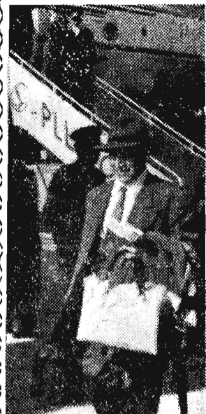
Na zdjęciu: Na lotnisku Okęcie w Warszawie.

W dniu 31 maja 1956 r. powrócił z USA do kraju, po 16 latach pobytu zagranicą emigrant Franciszek Sz wajdler.