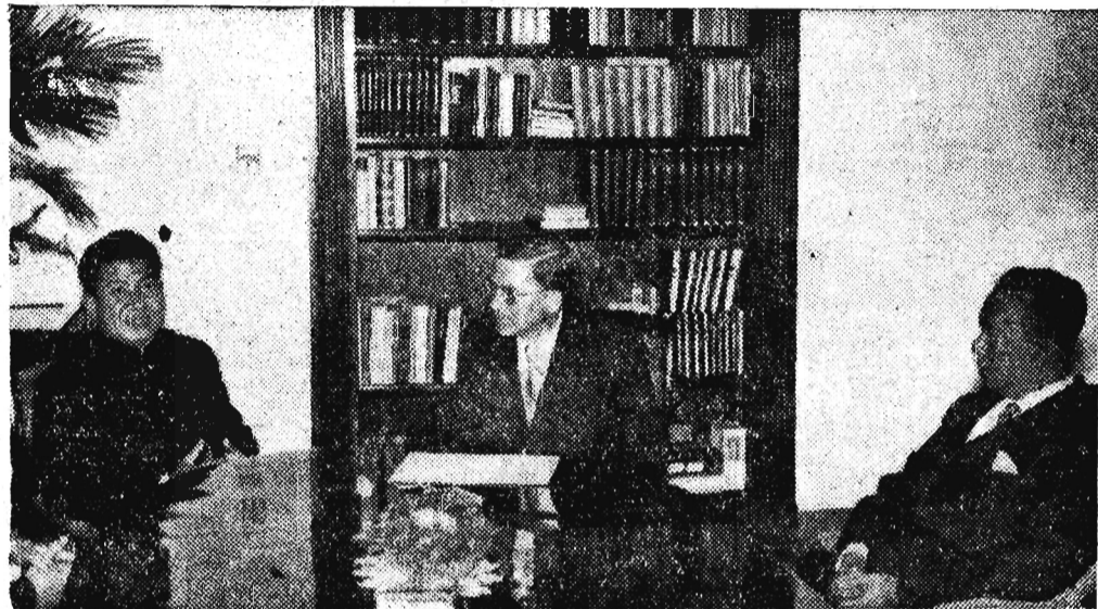
3. VI. 1956 r. - w pierwszym dniu pobytu w Warszawie - następcą tronu Kambodży księżę Norodom Sihanouk złożył wizytę przewodniczącemu Rady Państwa Aleksandrowi Zawadzkiemu.